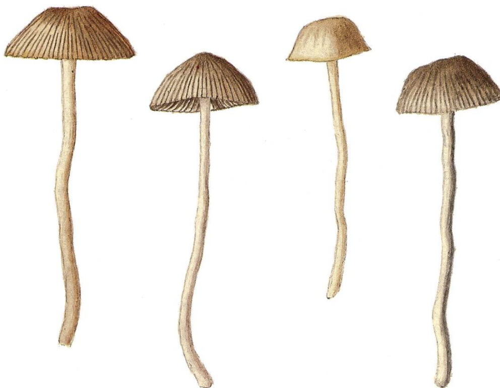
Fayodia bisphaerigera var. longicystis J. Favre