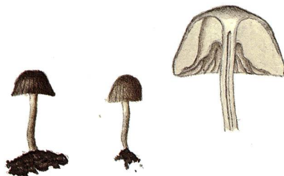
Fayodia anthracobia (J. Favre) Kühn.