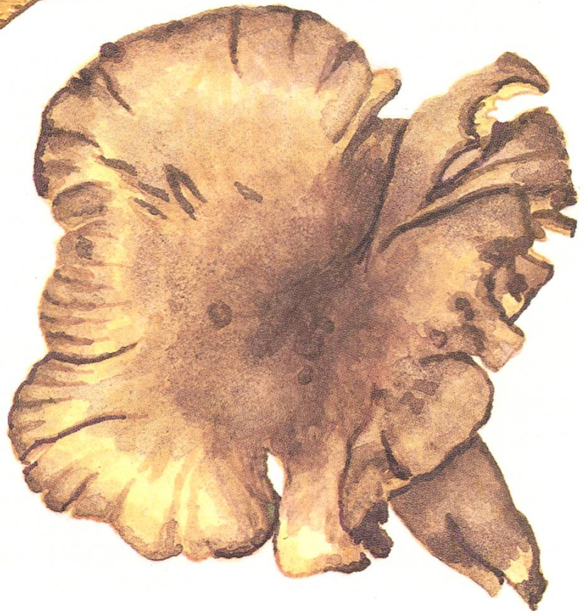
Lyophyllum ochraceum (Haller) Schwöbel.