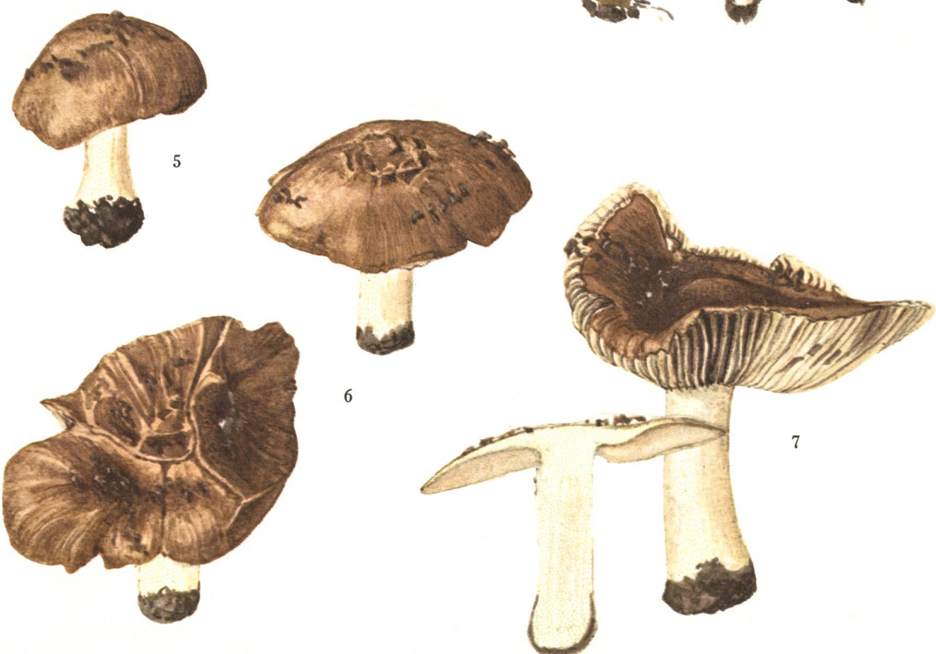
Inocybe phaeoleuca Kühner