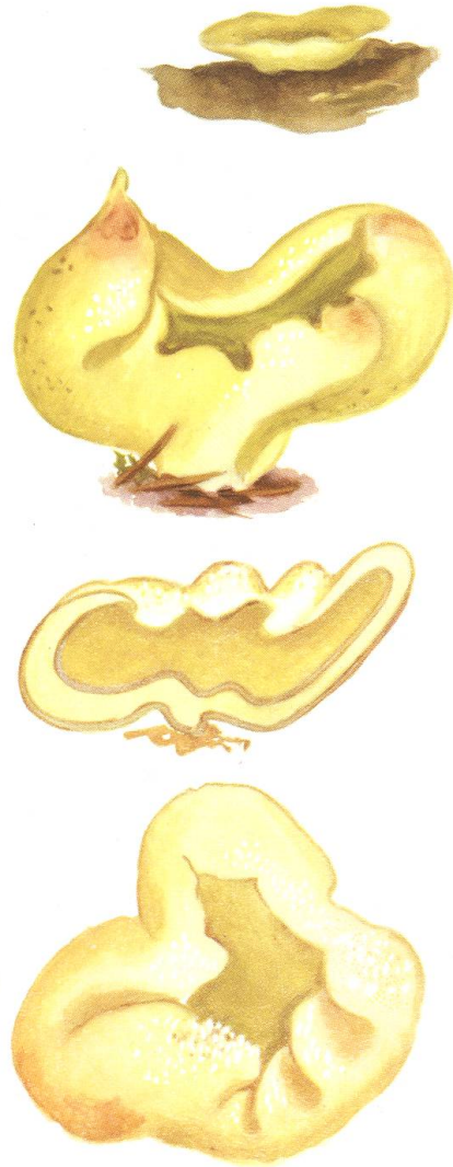
Galactinea sulphurea nov. sp.?