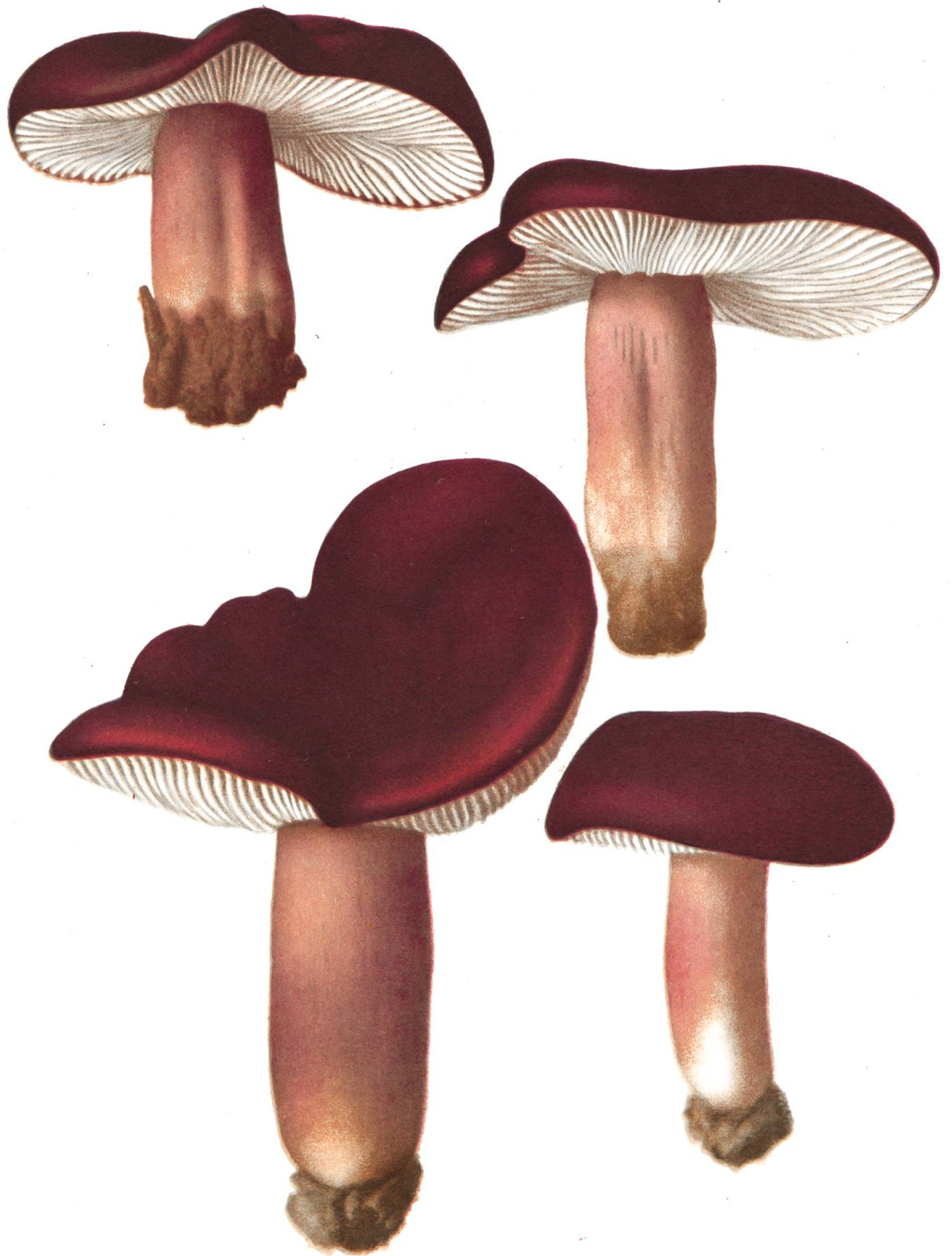
Russula rhodopoda Zw.