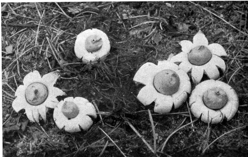
Abb. 4. Gewimperter Erdstern ( Geaster fimbriatus Fr.)