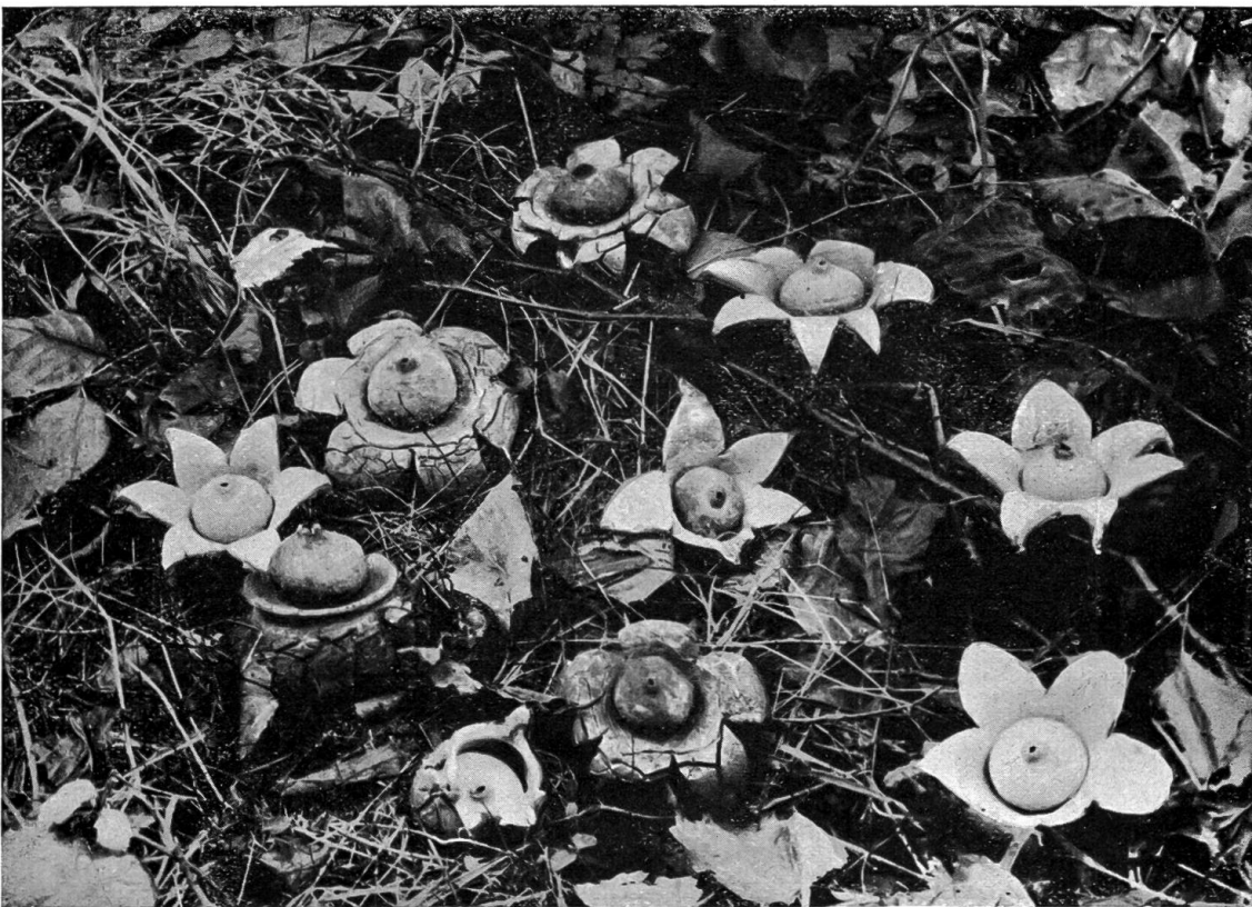
Abb. 2. — Halskrausen-Erdstern ( Geaster triplex ) in verschiedenen Entwicklungsstadien

(Die Klischees wurden in freundlicher Weise von „Natur und Museum“ der Senckenbergischen Naturforschenden Gesellschaft, Frankfurt a. M., zur Verfügung gestellt)