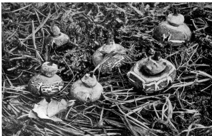
Abb. 5. Zierlicher Erdstern ( Geaster umbilicatus Fr. elegans Vitt.)