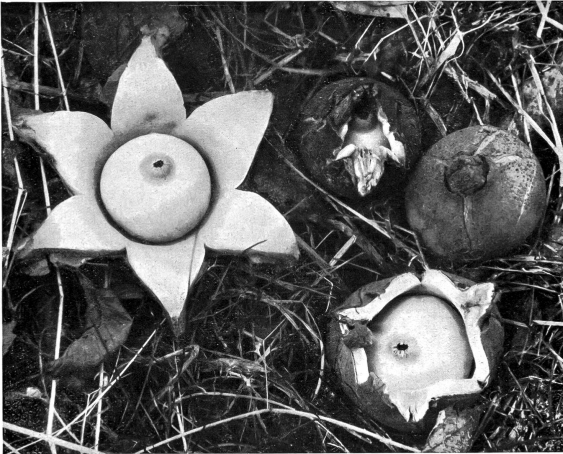
Abb. 1. — Halskrausen-Erdstern ( Geaster triplex ) beim Aufbrechen