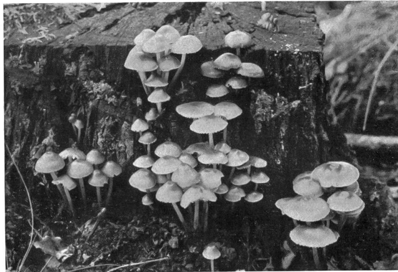
Rosablättr. Helmling, Myc. galericulata Scop.