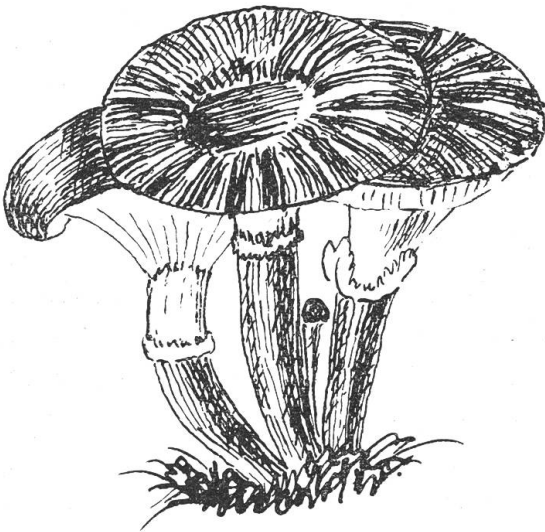
Tricholoma robusta .

2. Der echte, volkstümliche Hörtling, ein sehr guter Speisepilz, ein Pilzriese, bildet infolge seiner rudimentären Hülle am oberen Stielende den Übergang zu den Armillaria -Arten. Schweinitz und Rabenhorst erwähnen diesen Riesen-Ritterling nicht; vermutlich hielten sie ihn für eine grosse Abart von Agaricus robusta .