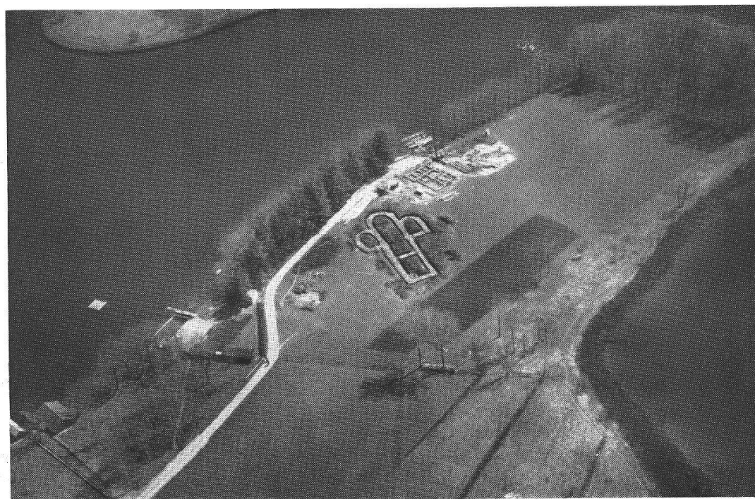
Fig. 2. Landzunge mit Ausgrabung von 1941.