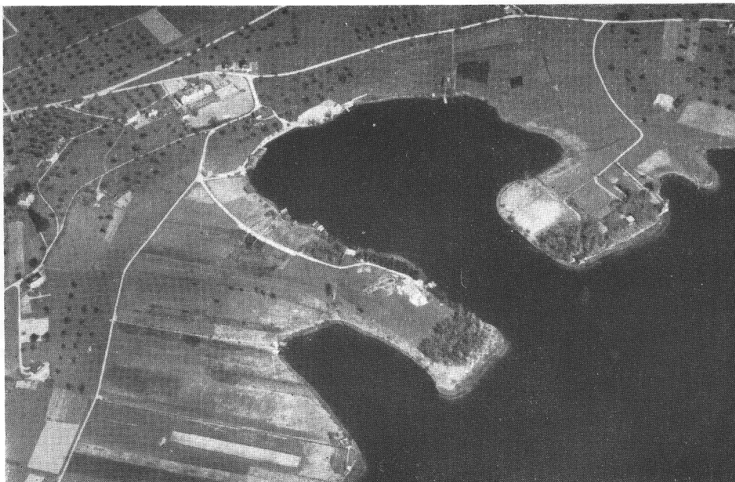
Fig. 1. NW-Ende des Sempachersees. Trichter mit der vorgeschobenen Landzunge, die einst eine isolierte Insel war.