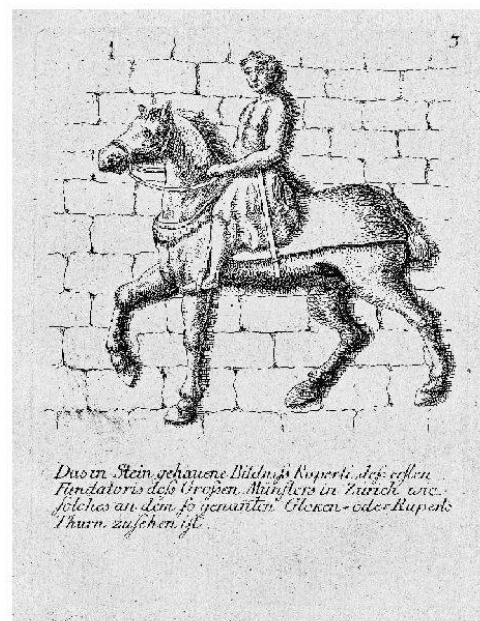
Teil I, Abb. III