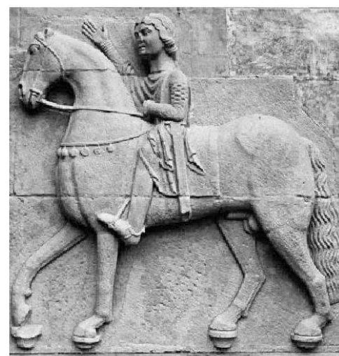
Anonym, Reiterrelief, um 1180, Stein, Zürich, Grossmünster, Glockenturm, Nordseite.