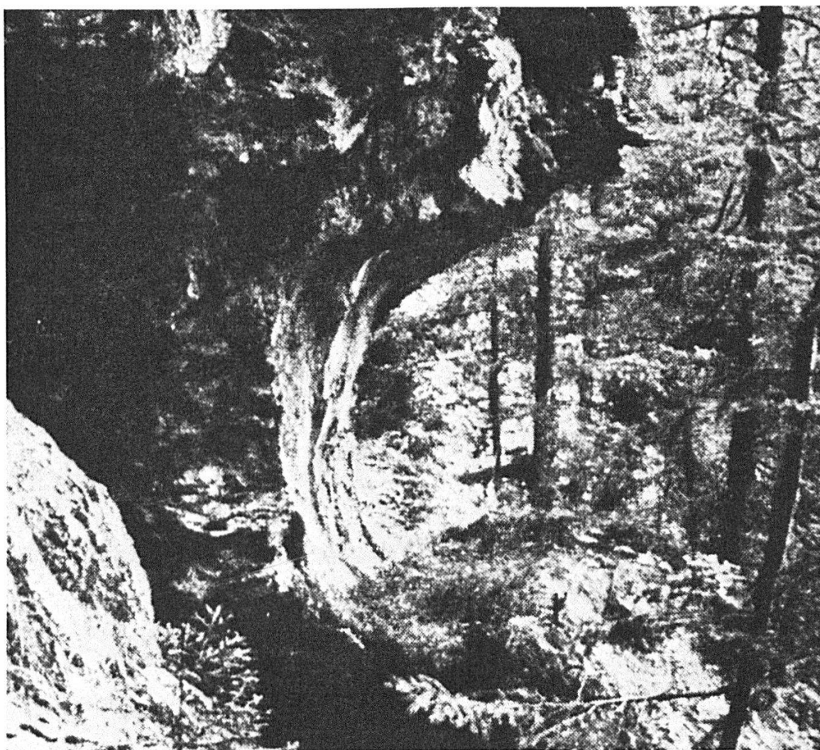
Planche III.