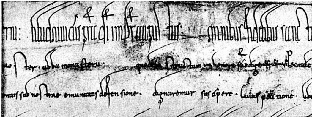
Abb. 1. M². 1222.

Hier stehen im Worte quia die beiden letzten Buchstaben und in dem folgenden Abtsnamen die beiden ersten Silben auf Rasur, die drei nächsten Worte sind ursprünglich; dann setzt mit dem Worte abba eine große radierte Stelle ein, die bis quatenus führt,