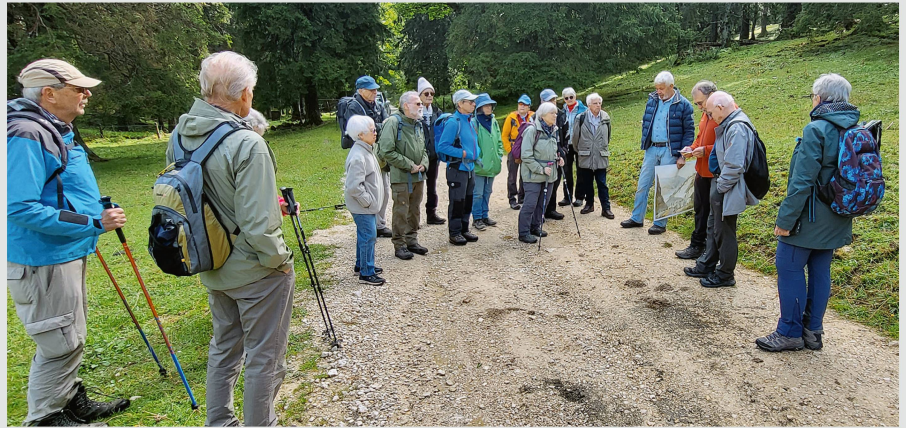
Das Semester 1969 unterwegs in den Wytweiden.