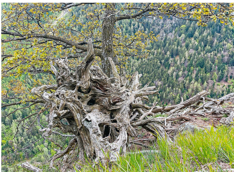
Abb 3 Das Totholzvolumen hat im Schweizer Wald in den letzten 30 Jahren zugenommen.