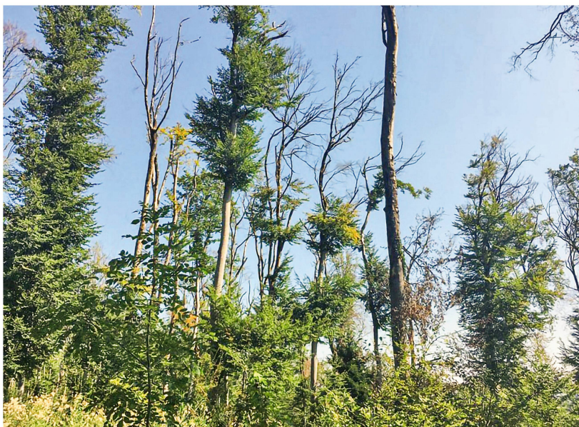
Abb 1 Als Folge der Trockenjahre sind im Jura Buchen grossflächig abgestorben oder geschwächt worden.

führt. Da die Bestimmungen von den Unternehmen unterschiedlich umgesetzt werden, plant das BAFU, einen regelmässigen Erfahrungsaustausch mit Kantonen, Unternehmen und Verbänden durchzuführen, um diese bei der Umsetzung zu unterstützen.