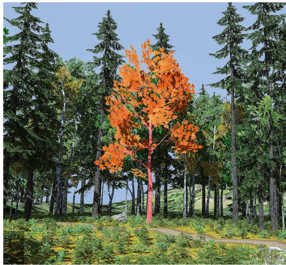
Abb 3 Screenshot des virtuellen Waldes.

zu entwickeln und darin durch den Klimawandel verursachte Unsicherheiten (z.B. auftretende Störungen, bisher unbekannte Schädlinge wie Pilze oder Insekten) zu integrieren (Griess et al 2023, diese Ausgabe).