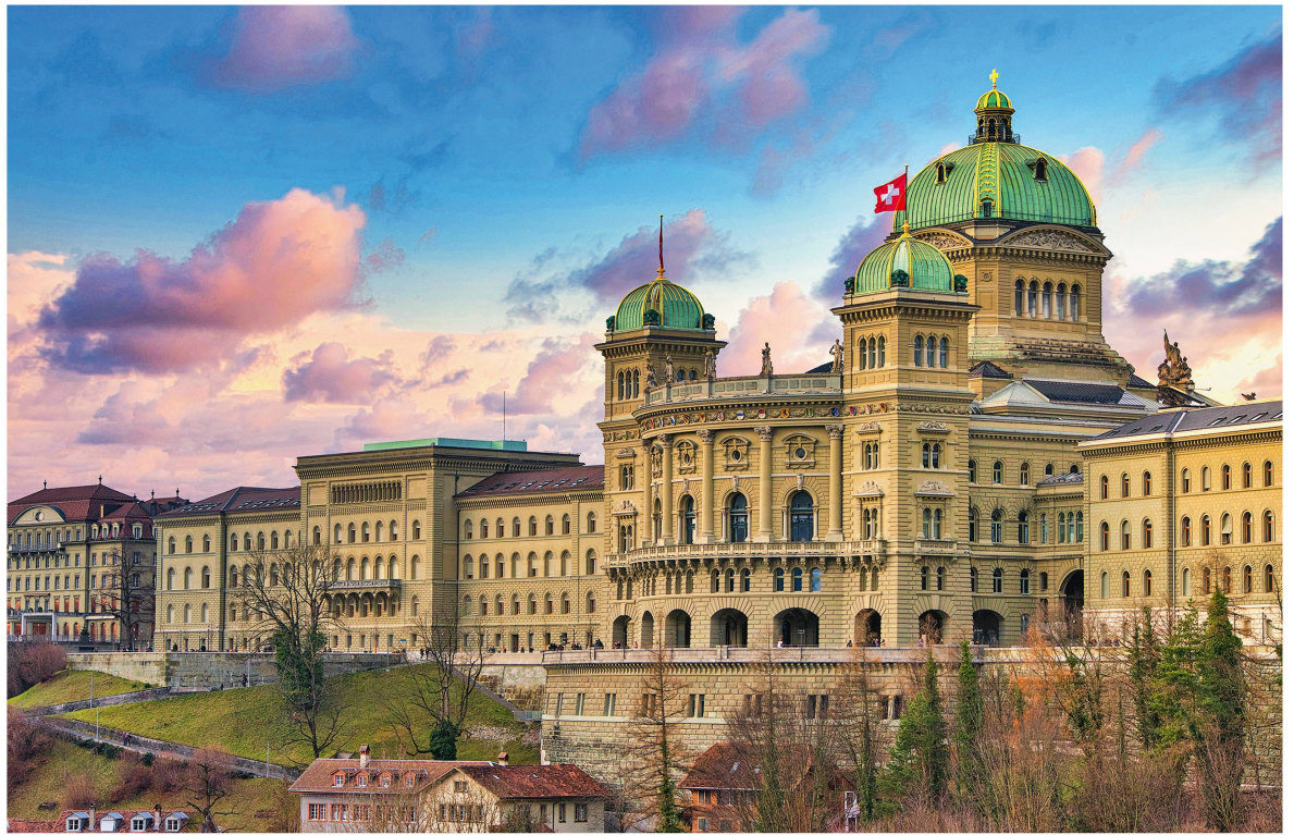
Abb 1 Verbundaufgaben im Wald- und Wildtiermanagement regelt der Bund zusammen mit den Kantonen.