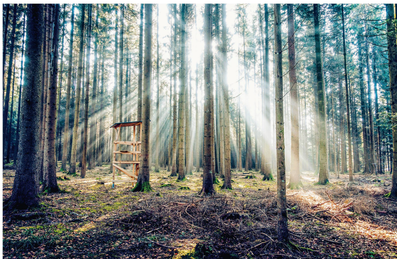
Abb 2 Waldverjüngung und Wildtierbestände: eine von vier Herausforderungen im Wald- und Wildtiermanagement aus Sicht der KWL.

schaftungspflicht besteht. Massnahmen können durch die Kantone nur bei der Schutzwaldpflege und bei erheblichen Waldschäden angeordnet werden. Weitere waldbauliche Massnahmen unterliegen dem Anreizsystem aus Bundes- und Kantonsbeiträgen. Demgegenüber bezahlen die Jagdberechtigten für die Jagdpacht im Reviersystem oder für das Jagdpatent im Patentsystem. Bei der Frage, wie die Ziele der kantonalen Jagdplanung erreicht werden können, spielen oft noch weitere Faktoren eine Rolle. Wird die kantonale Jagdplanung nicht vollständig umgesetzt, müssen Nachjagden organisiert werden.