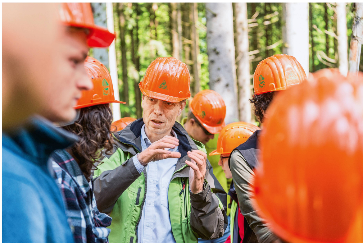
Abb 3 Die Kultur des Teilens von Wissen und Können in Lehre und Forschung ist ebenso wichtig wie die integrative Förderung von zukünftigen Fähigkeiten.