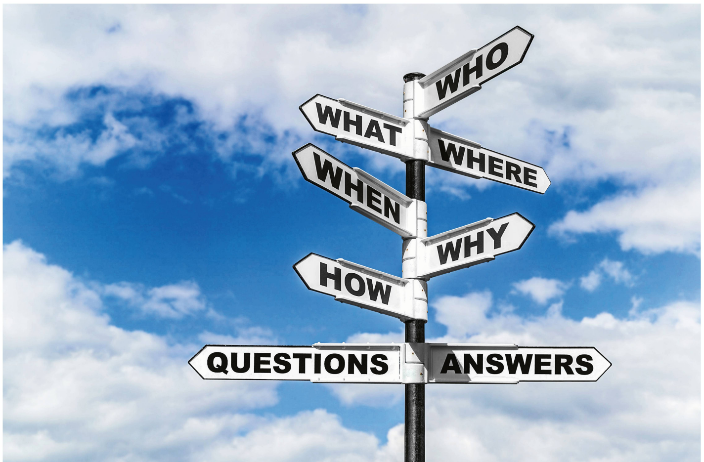
Abb 2 Mangelnde Koordinierung kennzeichnet das EU-Forstpolitikfeld.

Das Bundesministerium für Ernährung und Landwirtschaft (BMEL) sieht sich in der «Zuständigkeit für die gute fachliche Praxis für die Forstwirtschaft» und verfolgt auf EU-Ebene «das Interesse, dass hier keine Zuständigkeitsverlagerung eintritt» (Forst_1). Forstpolitik sei Nationalpolitik «und da legen wir grossen Wert darauf», so eine im EU-Parlament geäusserte Sicht (MEP_1). Vertretende von Bauern- und Waldbesitzerverbänden sowie diesen Verbänden nahestehende EU-Parlamentarier und EU-Parlamentarierinnen verwenden die Metapher der «Hintertür», um die Legitimität von walddrelevanten EU-Regelungen infrage zu stellen.