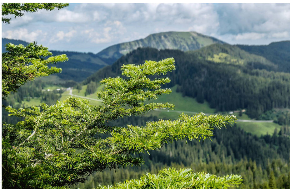
Abb 3 Dichte Benadelung ist häufig.

Die in der Untersuchungsfläche angetroffene Anzahl von 133 Tannen ist respektabel. Sie bedeutet, dass die Tanne fähig ist, oberhalb von 1700 m ü.M. zu keimen und bedeutende Bestände an Jungpflanzen zu bilden, selbst wenn in der Umgebung nur wenige Samenbäume vorhanden sind und der Samen