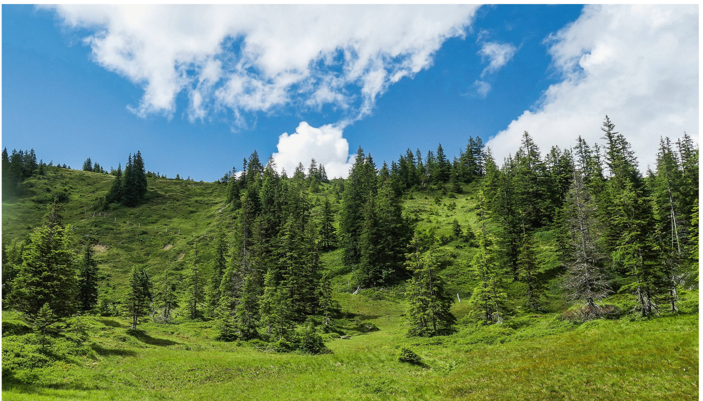
Abb 1 Einwachsener Bestand im Westteil der Untersuchungsfläche.

ton Glarus zum Beispiel wird im Schutzwald alle 60 m eine Tanne angestrebt (Rüegg 2015), was als Minimum für ausgewachsene Tannen gemeint ist. Dies ergibt knapp vier gesunde Tannen pro Hektare. Gemäss der Wegleitung «Nachhaltigkeit und Erfolgskontrolle im Schutzwald» (NaiS; Frehner et al 2005) sollte im Typischen Hochstauden-Tannen-Fichtenwald (Standorttyp 50) der hochmontanen