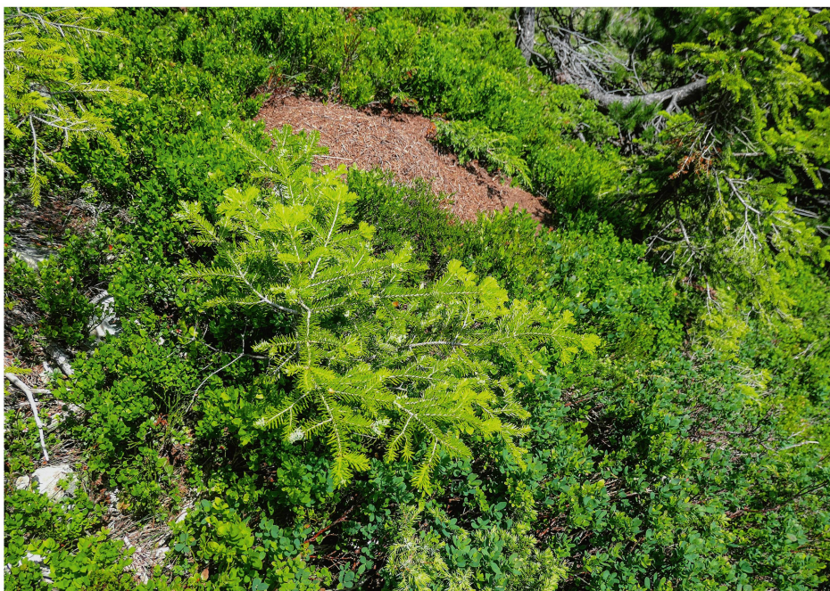
Abb 5 Jungtannen fanden sich oft in Freiflächen.

zunächst die konsequente Förderung von Samenbäumen. Nur wenn Tannensamenbäume vorhanden sind, ist die kostengünstigste Verjüngungsmethode, die natürliche Verjüngung, möglich. Die Tannenförderung kann auch noch aus weiteren Massnahmen bestehen: Kein Fällen von Tannen oberhalb 1600 m ü.M., Freistellen aller Tannen mit bedrängten Kronen, Ausbilden von grösseren Öffnungen in dichten Beständen, Verbissschutz.