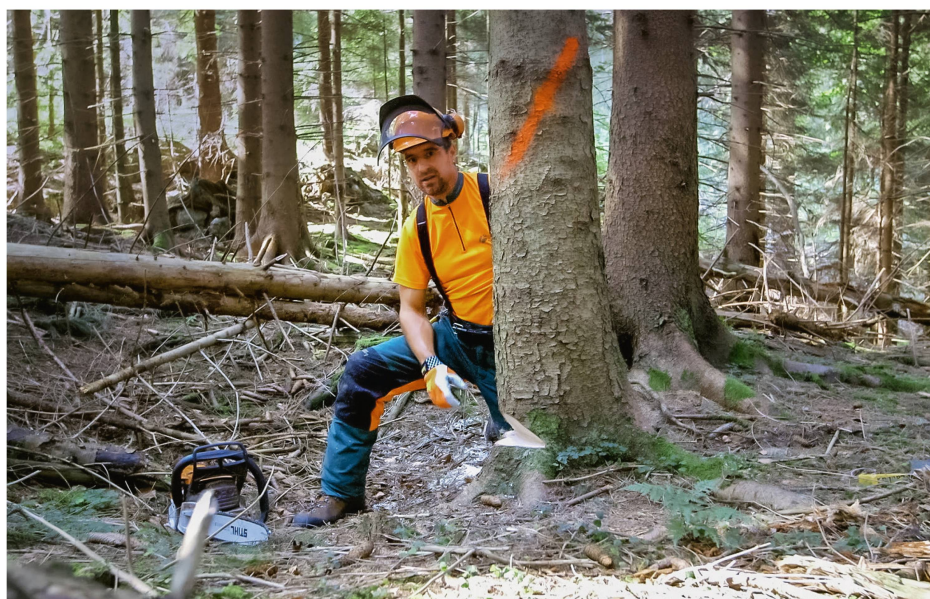
Abb 4 Das Video der Bayerischen Staatsforsten zur Sicherheitsfälltechnik hat sich zum absoluten Publikumsmagneten entwickelt.

Dass die Tutorials von den Bayerischen Staatsforsten stammen, hat viele Vorteile: