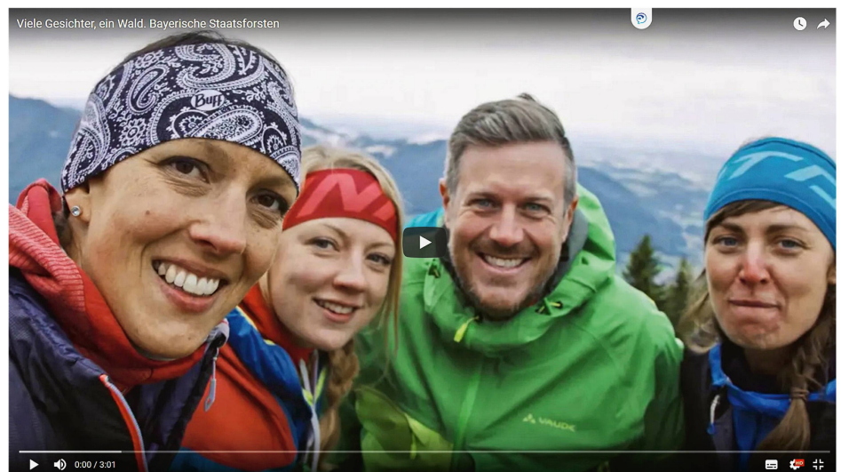
Abb 1 In der digitalen Kommunikation sprechen die Bayerischen Staatsforsten gezielt auch junge und wenig walddaffine Menschen an. Stillbild aus einem YouTube-Film.

Digitale Kommunikationskanäle werden in der forstlichen Öffentlichkeitsarbeit schon länger genutzt. Wer nicht digital unter-