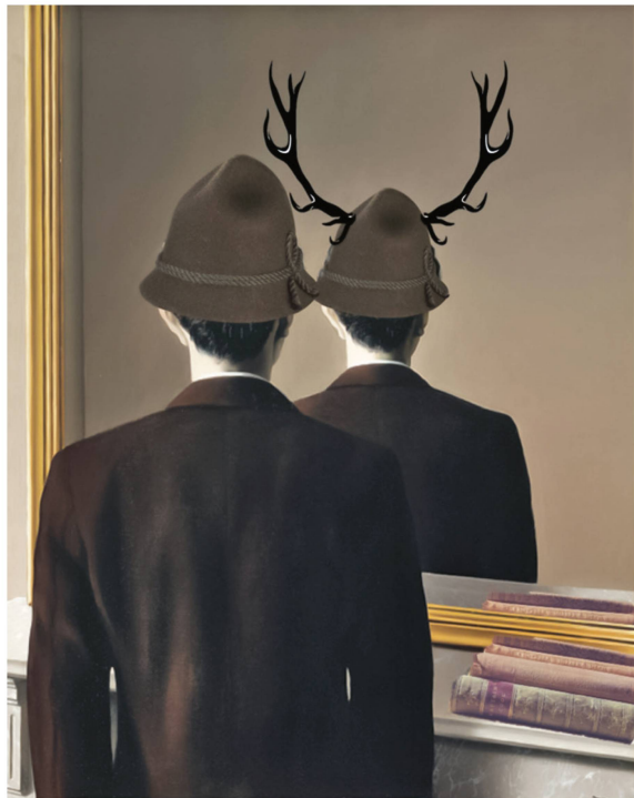
Abb 3 Wie nehmen wir uns wahr – und wie werden wir wahrgenommen? Oder: Ich ist ein anderer. Collage auf der Grundlage eines Bildes von René Magritte: Michael Suda

ren unsere Kommunikationspartner, so spürt die Gesellschaft, dass sie für unbefugt und ignorant gehalten wird. Das ist keine gute Voraussetzung für eine Kommunikation, die Glaubwürdigkeit und Vertrauen schaffen und eine kontinuierliche Holzproduktion legitimieren soll.