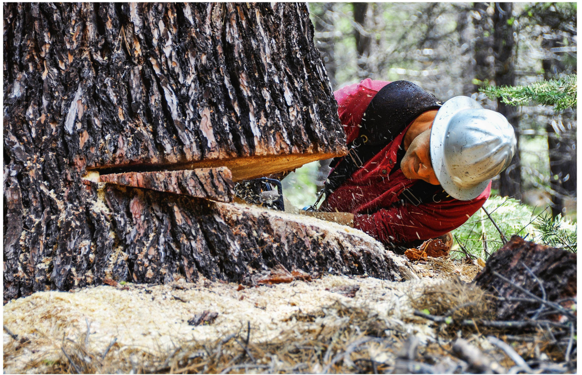
Abb 1 Freiwillig in der Opferrolle. Oder: Gefangen im «Schlachthausparadoxon».