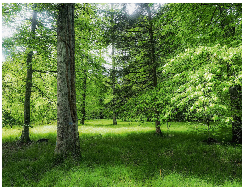
Fig. 1 Une bonne pénétration visuelle favorise la détente.