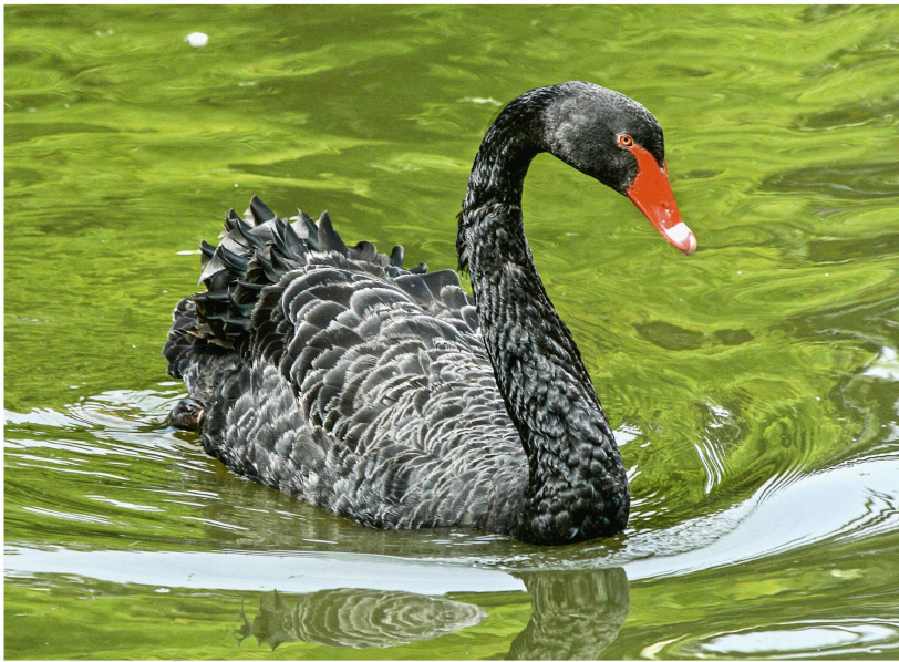
Abb 2 Das natürliche Verbreitungsgebiet des Schwarzschwans ( Cygnus atratus ) ist Australien. Schwarze Schwäne werden aber auch in der Forstwirtschaft der Schweiz in Zukunft eine bedeutende Rolle spielen.

des Klimageschehens, aber sie sind wesentlich weniger zuverlässig für die Variabilität um die Mittelwerte. Das heisst, es ist schwierig, extreme klimatische Ereignisse in solchen Szenarien realitätsnah abzubilden. Deswegen verwenden wir für forstliche Analysen der Auswirkungen in aller Regel nur Veränderungen der Mittelwerte (z.B. Bugmann & Huber 2020) und ignorieren Veränderungen in den Extremereignissen.