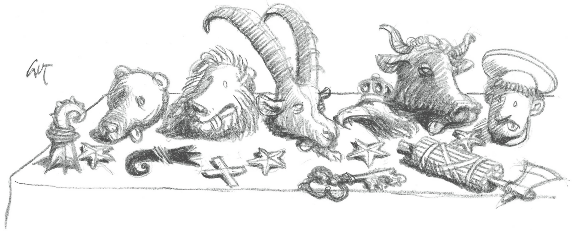
Abb 1 Die Kantone, zentrales Element des schweizerischen Föderalismus.

des mit, insbesondere an der Rechtsetzung (vertikaler kooperativer Föderalismus, Vatter 2014). Der Bund hat deshalb die Kantone rechtzeitig und umfassend über seine Vorhaben zu informieren und ihre Stellungnahmen einzuholen, wenn ihre Interessen betroffen sind (Art. 45 BV).