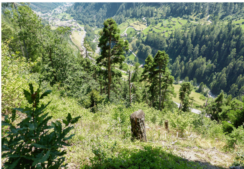
Abb 1 Waldföhrenbestand bei Viano (Brusio, GR), der sich in einen Laubwald entwickelt.