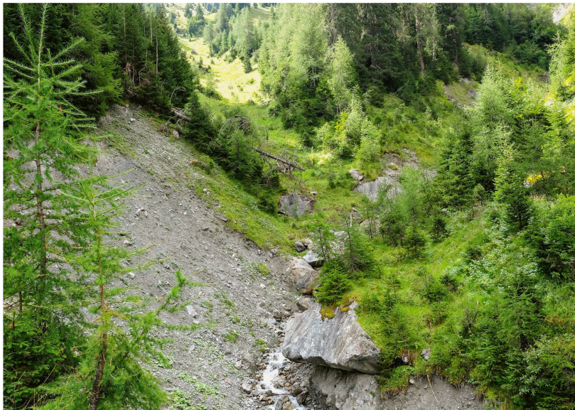
Abb 2 Rutschung in einen murgangfähigen Bach mit obenliegendem, stabilisierendem Schutzwald (Drostobel, Klosters, GR).

ten modelliert. Der Prozess «Rutschungen» umfasste dabei Hangmuren und flachgründige Rutschungen. Nicht berücksichtigt wurden permanente mittel- und tiefgründige Rutschungen, weil der Einfluss des Waldzustandes auf diese Prozesse limitiert ist. Für die Modellierung der Rutschungen wurden die in Tabelle 1 aufgeführten Datengrundlagen verwendet (detaillierte Informationen sind in Losey & Wehrli 2013, Anhang 1, zu finden).