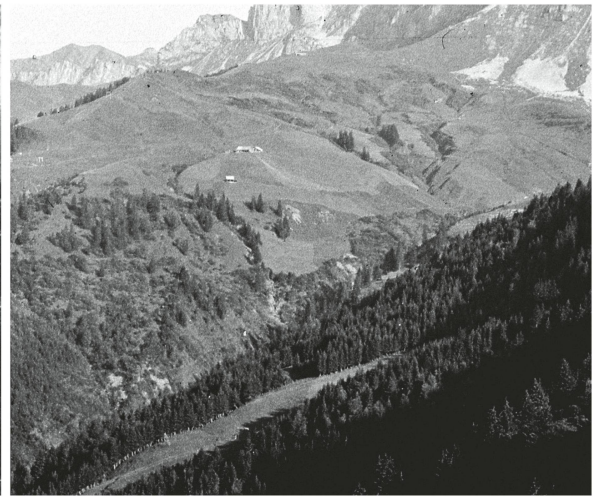
Abb 1 Einzugsgebiet des Gangbachs im Schächental (UR) im Jahr 1911 mit vielen offenen Rutschflächen (links) und 1982 mit deutlich höherem Waldanteil und stabileren Einhängen (rechts).

werke wie Schutzbauten geschaffen. Die fachliche und politische Auseinandersetzung mit dem Thema führten schliesslich zu den Bundesgesetzen über die Forstpolizei (1876) und über die Wasserbaupolizei (1877; Schweizerischer Bundesrat 2016). 1886 stellte Elias Landolt in einer vom Schweizerischen Forstverein herausgegebenen Publikation fest, dass zur Verminderung von Hochwasserschäden in den letzten 30 Jahren an den grösseren Gewässern viel getan worden war, dass aber, sollten die Schutzbauten an diesen Flüssen ihre Aufgabe dauernd erfüllen, auch die geschiebeführenden Zubringerbäche in einen Zustand gebracht werden müssen, der den Geschiebeeintrag vermindert (Abbildung 1). Als Massnahmen dafür schlug er nebst technischen Verbauungen auch biologische Massnahmen wie Aufforstungen und Begrünungen in Gewässereinhängen vor (Landolt 1886). Die Schutzwirkung des Waldes bei Gerinneprozessen wurde damit früh erkannt. Allerdings erfolgte erst mit der harmonisierten Schutzwaldausscheidung gemäss SilvaProtect 2011 eine konsequente Berücksichtigung der indirekten Prozesse (Losey & Wehrli 2013).