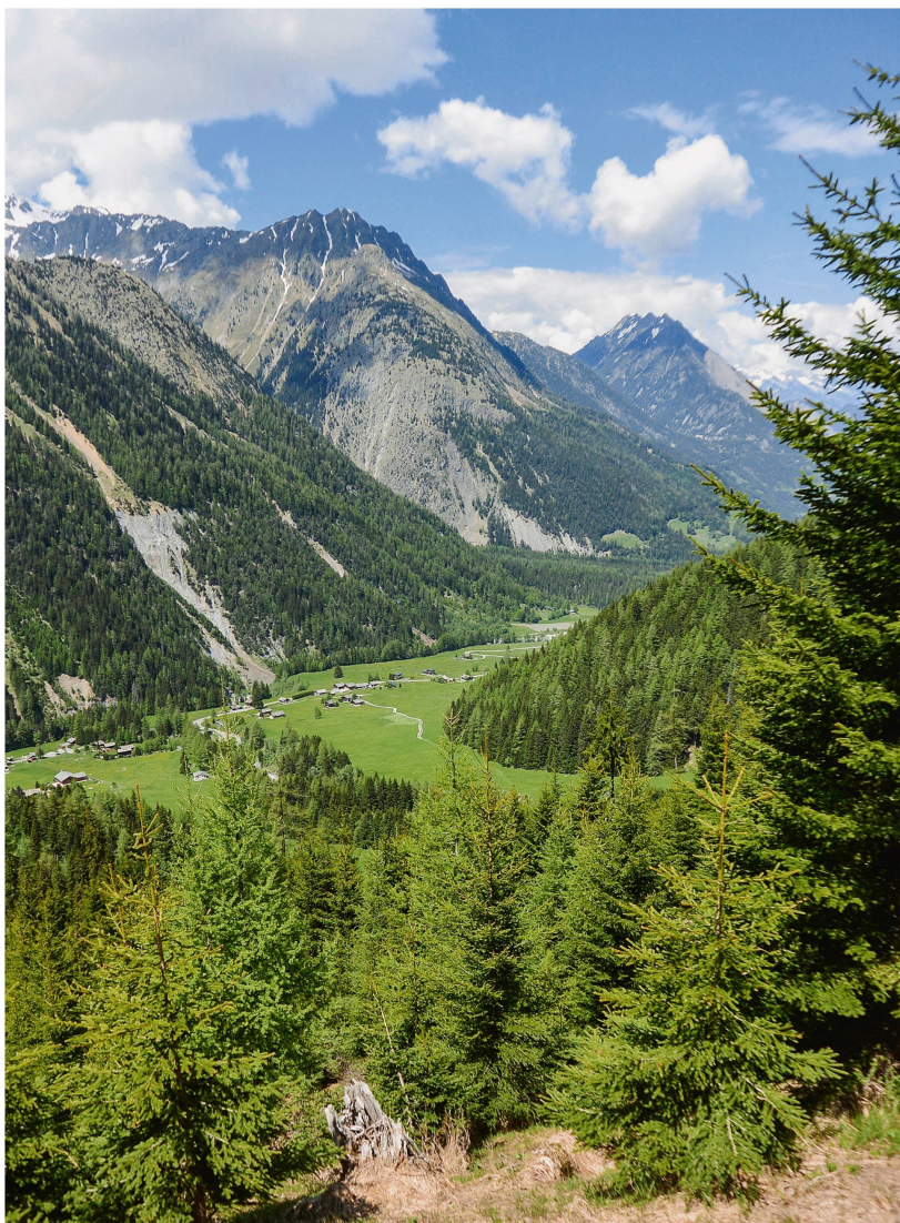
Fig. 1 La forêt remplit plusieurs fonctions sur les plans environnemental, social et productif. Elle protège notamment les habitations et les infrastructures contre les dangers naturels.