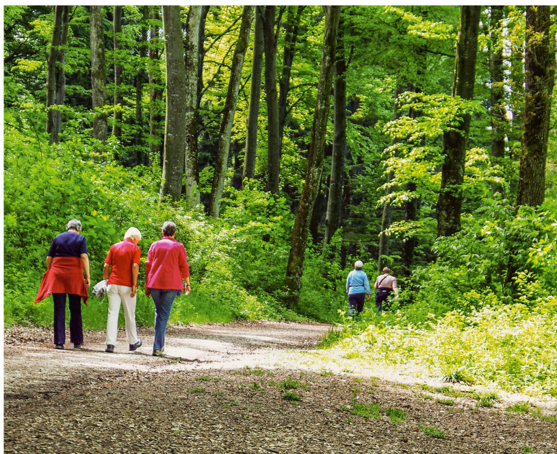
Fig. 3 La fonction de loisirs et de détente de la forêt est très appréciée par la population suisse.

que la disposition à payer est plus élevée chez la population citadine que parmi la population rurale. Une enquête menée dans le canton de Genève a montré que les Genevois étaient prêts à payer davantage pour les réserves forestières de toute la Suisse que pour celles situées sur leur propre territoire cantonal, ce qui justifie un cofinancement des réserves par la Confédération (Borzykowski et al 2018).