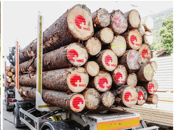
Abb 2 Der Schlüssel zum Erfolg liegt darin, dass die Waldwirtschaft leistungsfähiger wird, ihre Produkte und Leistungen besser verkauft und die Promotion für Schweizer Holz intensiviert wird.