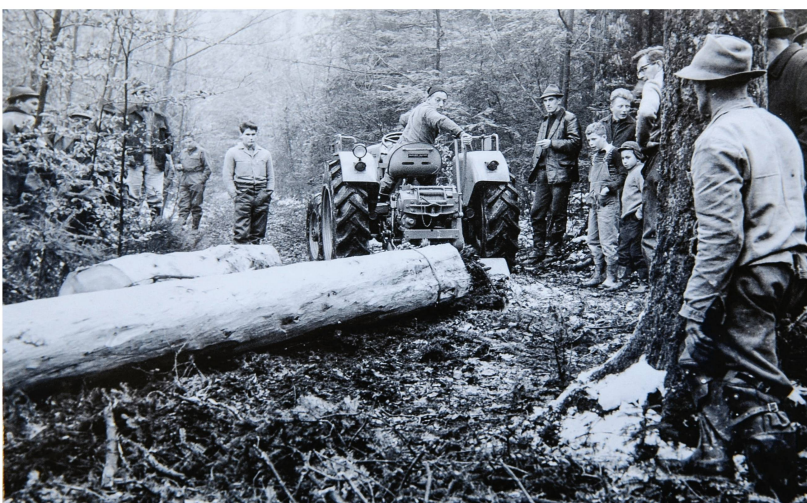
Abb 1 In der Wald- und Holzwirtschaft hat sich alles verändert, nur der Holzpreis nicht.

Mit der Lancierung des Förderprogramms «Holz 21» konnte der Trend nicht gestoppt werden. Der Einsatz von Holz nahm zwar tendenziell zu, die Holzernte ging jedoch weiterhin zurück. Im Jahr 2017 lag sie bei 4.69 Mio. Kubikmeter (BAFU 2018) und damit noch etwas tiefer als 2001. Der Bund ist weit davon entfernt, sein von ihm 2011 in der «Waldpolitik 2020» (BAFU 2013) formuliertes Schwer-