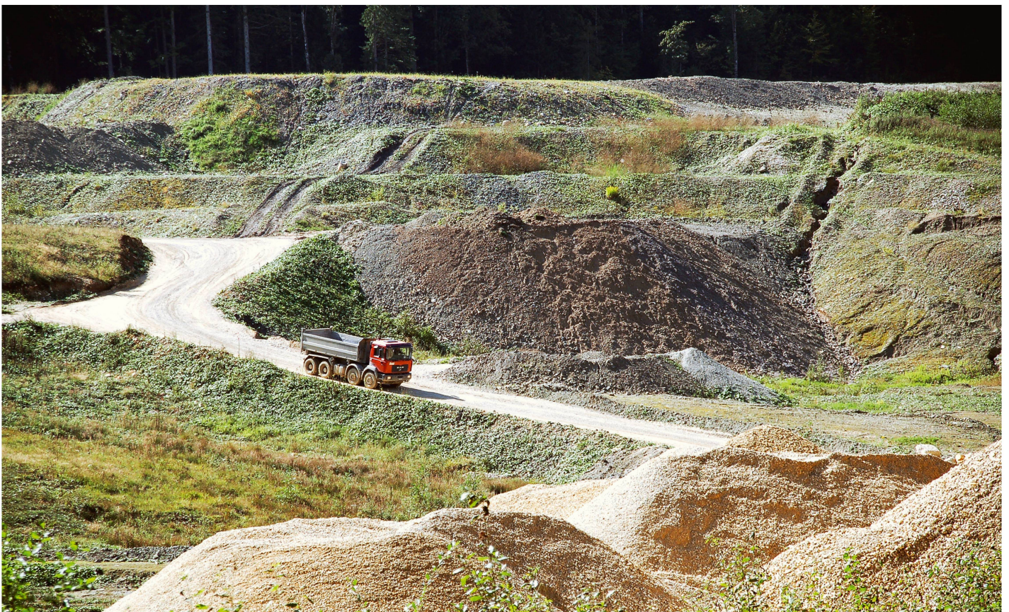
Abb 1 In einer der fünf Fachstrategien sind Rahmenbedingungen, Herausforderungen und Ziele für die Walderhaltung im Kanton Bern festgehalten.

* Seidenhofstrasse 12, CH-6003 Luzern, E-Mail walker@interface-pol.ch