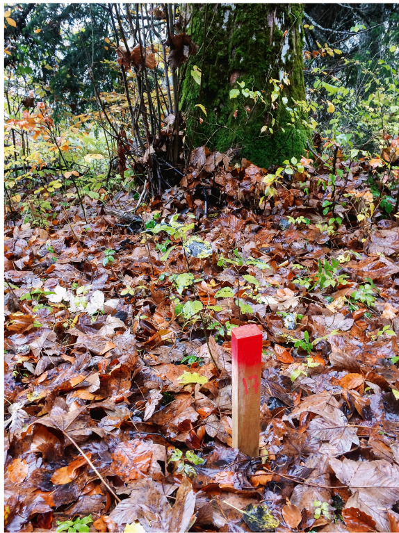
Abb 3 Im Jahr 2018 entschied das Bundesgericht drei Fälle im Zusammenhang mit Waldfeststellung.