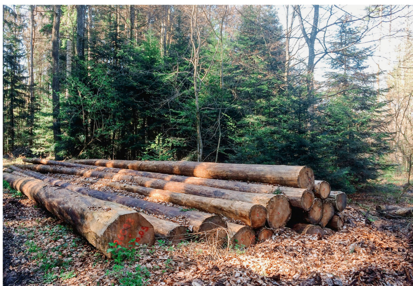
Abb 1 Mit einer Motion fordert der Ständerat eine Erleichterung der Rundholzlagerung im Wald für Eigentümer und Sägereien.

Bereits im Jahresrückblick 2017 (Tschannen et al 2018) wurde über die zwei gleichlautenden und angenommenen Motionen 17.3855 und 17.3843, «Gleich lange Spiesse für Schweizer Holzexporteure gegenüber ihrer europäischen Konkurrenz», berichtet. Statt durch das Bundesgesetz über den Verkehr mit Tieren und Pflanzen geschützter Arten (BG-CITES; SR 453) will der Bundesrat das Problem der illegalen Holzschläge nun mit einer Revision des Bundesgesetzes über den Umweltschutz (Umweltschutzgesetz, USG; SR 814.01) angehen. Damit könnte der Bundesrat auf Verordnungsstufe Anforderungen an das Inverkehrbringen von Holz und Holzzeugnissen erlassen oder dieses unter bestimmten Voraussetzungen auch verbieten. Eine Sorgfaltspflicht für die Inverkehrbringer soll ebenfalls ermöglicht werden (BBI 2019 1251).