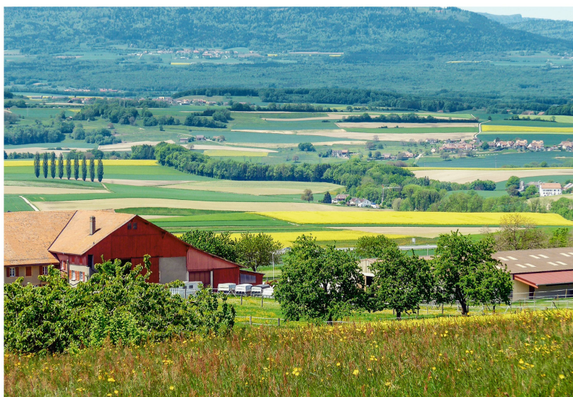
Abb 4 Die zweite Etappe zur Revision des Raumplanungsgesetzes betrifft das Bauen ausserhalb der Bauzonen.

drehte sich vor allem um die Frage der Bejagung des Wolfs, aber auch anderer Arten wie Biber und Luchs und war entsprechend umstritten. In den meisten Punkten folgte die kleine Kammer dem Bundesrat. So soll der Wolfsbestand reguliert werden können, wenn durch das Raubtier grosser Schaden entsteht (vgl. Tschannen et al 2018). Der Ständerat will jedoch noch weitergehen und die Jagd auf den Wolf auch in den 42 eidgenössischen Jagdbanngebieten zulassen. Im Nationalrat wurde die Vorlage noch nicht besprochen.