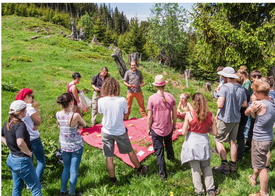
Abb 1 Nicht in allen Fachgebieten sind die Arbeitgeber zufrieden mit den Kenntnissen der bisherigen Absolvent/innen: Eine Neuorganisation der Kurse soll dazu führen, dass künftig mehr Studierende die Dendrologie-Exkursionen besuchen, um sich Kenntnisse über die einheimischen Gehölze anzueignen.