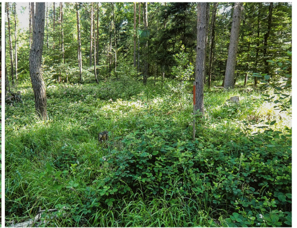
Abb 1 Ein solch grosses Nest direkt am Wegrand wie im linken Bild wird unmöglich übersehen. Dagegen wird das kleine, durch Vegetation überdeckte Nest im rechten Bild nur bei genauem Hinschauen entdeckt (das Nest befindet sich beim roten Markierungspfahl).

Grossbritannien (Procter et al 2015). Eine schweizweite Habitatstudie der Waldameisen wurde ausserdem von Vandegehuchte et al (2017) durchgeführt.