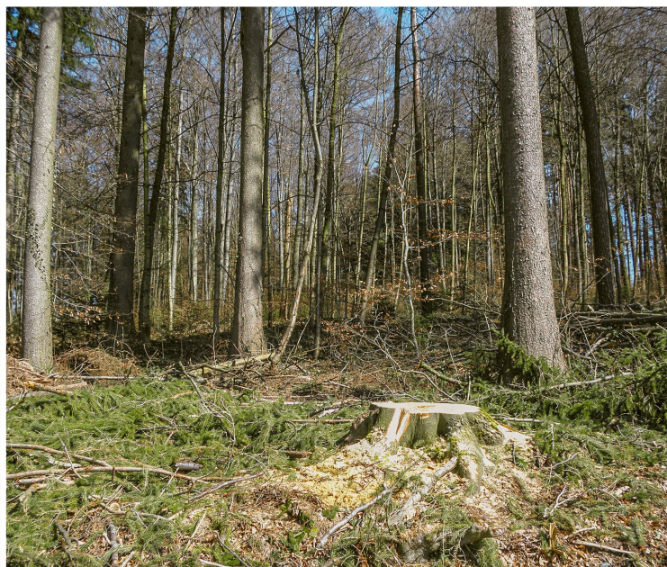
Abb 3 In Bezug auf die Klimaschutzleistung der Wald- und Holzwirtschaft steht in den Tropen die Reduktion von Entwaldung und Walddegradierung sowie die Regenerierung degradierter Wälder im Vordergrund (Bild links), bei uns hingegen eine intensivere, aber immer noch nachhaltige Holznutzung (Bild rechts).

erhalten oder gar zu fördern. Wälder sind derzeit die einzigen direkt beeinflussbaren CO 2 -Senken. Durch Massnahmen wie grossflächige Aufforstungen und nachhaltige Waldbewirtschaftung liessen sie sich weiter fördern.