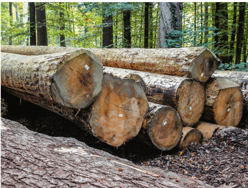
Abb 4 Holz ist unabdingbarer Pfeiler einer CO 2 -neutralen Ökonomie. Das spricht für eine vermehrte Holznutzung in den Schweizer Wäldern.

Die konkrete Umsetzung erweist sich aber vielerorts als schwierig. Wie bereits betont, müssen in den meisten Ländern die notwendigen technischen und gesellschaftlichen Kapazitäten erst noch geschaffen werden, damit der Wald (REDD+) zu einem kontrollierbaren und wirksamen Mechanismus in