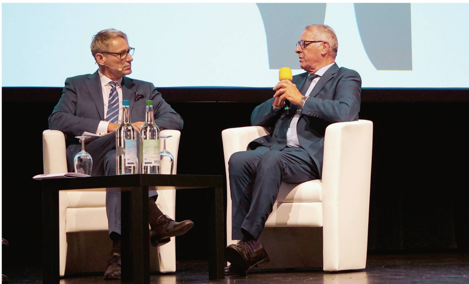
Abb 3 Mit der Rede alleine wars noch nicht getan: Franz Fischlin wollte von alt Bundesrat Adolf Ogi noch viel mehr wissen.

Leuthard zeigte sich überzeugt, dass in einer so schnelllebigen Welt wie der heutigen die Menschen das Bedürfnis nach einem Ruhepol hätten, nach einem Erholungsraum, und das sei oft der Wald. Sie wünschte sich auch, dass die Wege in den Wald gut unterhalten sind. «Wenn wir den Wald in der Bevölkerung gut verankern wollen, dann müssen die Menschen in den Wald können. Wir müssen den Wald öffnen und zeigen, wie schön er ist», sagte sie.