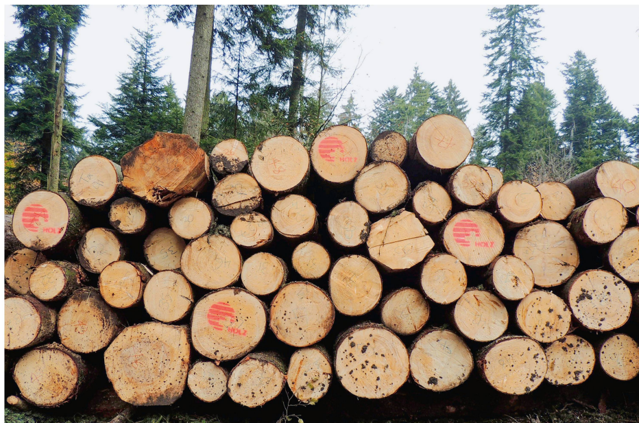
Abb 1 Mit einer Motion möchte die UREK-S die Lagerung von Schweizer Rundholz im Wald erleichtern.