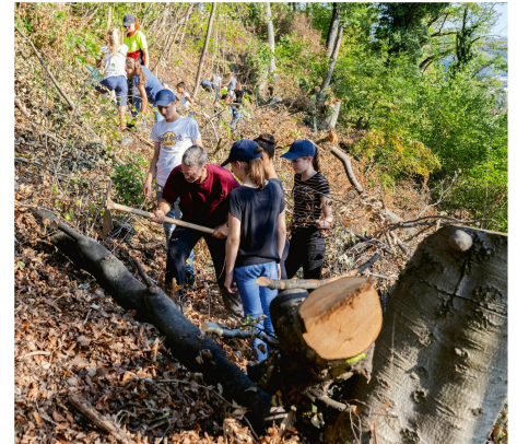
Abb 3 Im Rahmen des Schutzwaldprojekts in den Kantonen Basel-Landschaft und Basel-Stadt pflanzen Schülerinnen und Schüler Bäume.

Seit 2011 engagiert sich Helvetia für die Pflanzung von Schutzwäldern. Zu diesen zählen nicht nur Bergwälder im alpinen Raum, sondern auch andere Waldflächen, welche Bevölkerung und Infrastrukturen vor Steinschlag, Erdbeben, Lawinenbildung und Murgang schützen.