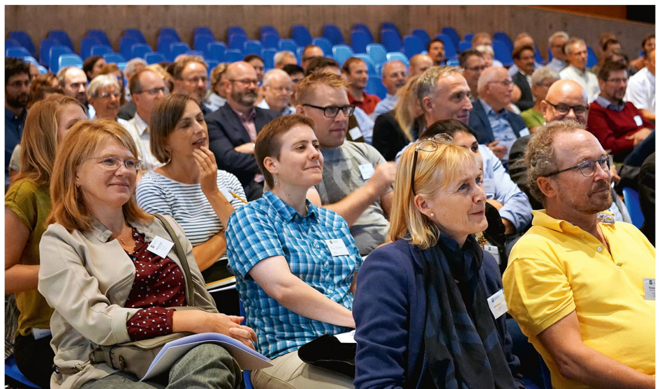
Abb 1 Die Rednerinnen und Redner zogen das Publikum in ihren Bann.

« Unspektakuläre » Vision der Bundesrätin Ein Höhepunkt war zweifellos die Anwesenheit von Bundesrätin Doris Leuthard (Abbildung 2). Sie hielt eine gehaltvolle, mit persönlichen Elementen angereicherte Rede. Der SFV habe Wesentliches geleistet, sagte sie. Die Förster hätten erkannt, dass nur ein geschützter Wald auch genutzt werden könne, und sich somit schon früh für die Nachhaltigkeit eingesetzt. Mit der Waldpolitik 2020 habe der Bund versucht, die unterschiedlichen Anforderungen unter einen Hut zu bringen. «Meine Vision zum Wald ist unspektakulär», sagte Leuthard. «Ich möchte, dass diese Waldleistungen weiterhin erbracht werden und dass sich der Wald gar nicht so sehr verändert.» Um diese Ziele zu erreichen, brauche es jedoch ziemlich viele Anstrengungen. Laut der Bundesrätin sind dafür Pragmatismus, Besonnenheit und Offenheit nötig – so wie es der SFV seit 175 Jahren vorbildlich pflege. Dieser sei eine Art Thinktank für den Wald. Und solche guten Dienste und der Austausch zwischen Politik, Wirtschaft, Verbänden und Wissenschaft würden in Zukunft noch mehr gebraucht.