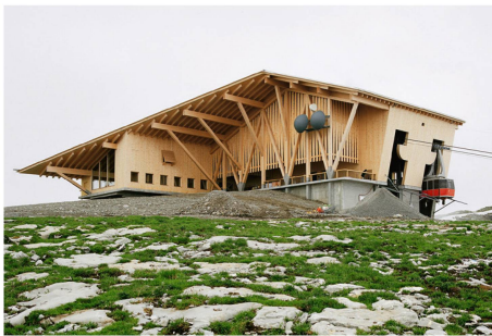
Abb 2 Die Bergstation Chäserrugg der Architekten Herzog & de Meuron erhielt die höchste Auszeichnung.

Am 27. September wurden die nationalen Preisträger des Prix Lignum 2018 geehrt. Gold ging an die Bergstation Chäserrugg im Toggenburg (SG; Abbildung 2), Silber an das Holzhochhaus in Rotkreuz (ZG) und Bronze an die Langhäuser in Zürich (ZH). Vier Objekte wurden mit dem Sonderpreis «Schweizer Holz» ausgezeichnet: das kantonale Polizeigebäude in Granges-Paccot (FR), die Produktionshalle der BLS in Bönigen (BE), das Mondhaus in Alpnach (OW) und der Turm im Natur- und Tierpark Goldau (SZ). ■