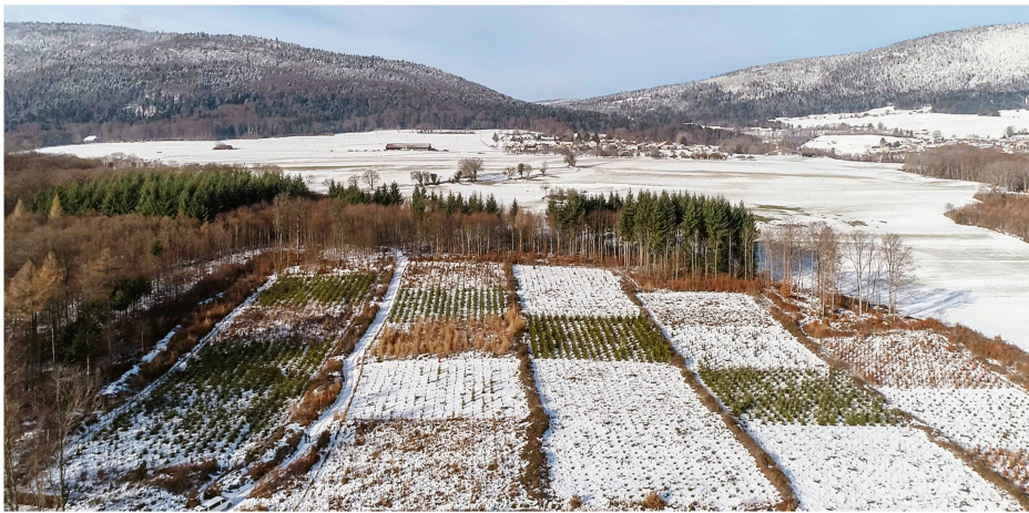
Abb 2 Luftaufnahme der bestehenden Testpflanzung mit gebietsfremden Baumarten bei Mutrux. Die geplanten Testpflanzungen sollen insgesamt und was die Teilflächen pro Baumart betrifft kleiner sein als die hier gezeigte Pflanzung.

«REINFORCE» an rund 40 Standorten entlang der europäischen Atlantikküste Versuchspflanzungen mit jeweils mehr als 2000 Bäumen eingerichtet, mit denen Erkenntnisse über die Eignung von 38 Baumarten und insgesamt 150 Provenienzen im zukünftigen Klima gewonnen werden sollen (Orazio et al 2013). Ein kleines Netzwerk von fünf Versuchsflächen in Mitteleuropa – eine davon bei Mutrux, Kanton Waadt – wurde auch im Projekt «Gastbaumarten» etabliert, in dem fünf gebietsfremde Baumarten getestet werden (Brang & Ninove 2015; Abbildung 2).