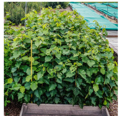
Abb 3 Halbjährige Baumhaseln ( Corylus colurna ) der bulgarischen Provenienz Byala im Saatbeet des WSL-Pflanzgartens in Birmensdorf.

Die Baumarten werden in ihrem heutigen Höhenbereich sowie in den ein bis zwei nächst höher gelegenen Höhenstufen getestet, zum Beispiel die Fichte ( Picea abies ) von der submontanen bis in die obersubalpine Höhenstufe. Zudem sollen die Baumarten über die heutige regionale Verbreitung hinaus gepflanzt werden, um ihre ökologischen Grenzen besser erfassen zu können, zum Beispiel