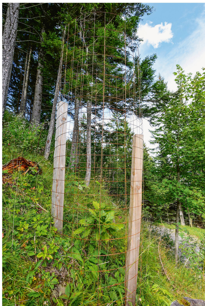
Abb 1 Natürlich verjüngte Traubeneiche weit ausserhalb ihres heutigen Verbreitungsgebiets, die mit einem massiven Drahtkorb vor Wildverbiss geschützt wurde. Sulzboda, Malbun (Fürstentum Liechtenstein), 1350 m ü. M.

* Zürcherstrasse 111, CH-8903 Birmensdorf, E-Mail brang@wsl.ch