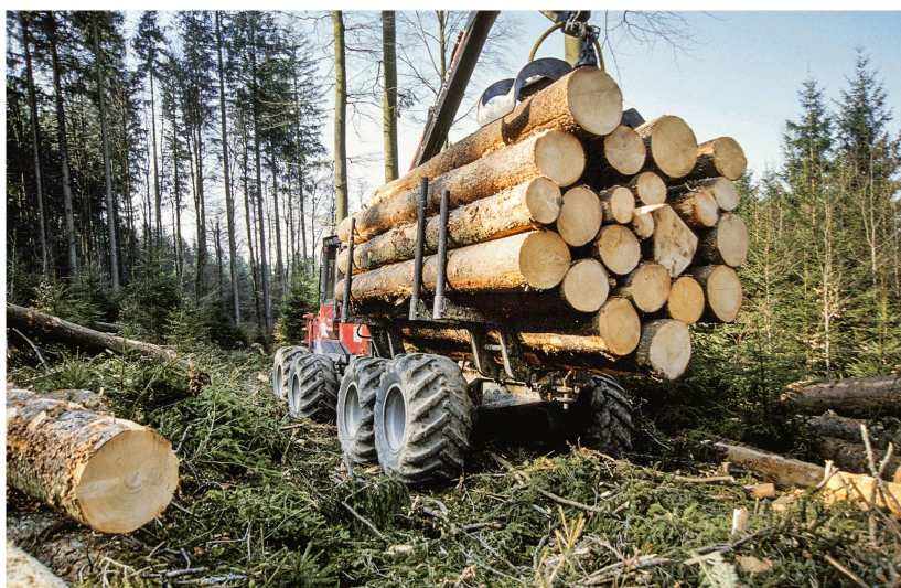
Abb 2 Die Zwischenevaluierung der Waldpolitik 2020 zeigt, dass das Potenzial des nachhaltig nutzbaren Holzes noch zu wenig ausgeschöpft wird.

Klimawandel und Schadorganismen. Bei den Zielen «Ausschöpfung des Holzpotenzials» (Abbildung 2) und «Wirtschaftlichkeit der Waldwirtschaft» zeigen sich laut Autorinnen deutliche Defizite. Gemäss Bericht sind tiefe Holzpreise und teilweise hohe Erntekosten, aber auch kleinräumige Besitzstrukturen Gründe dafür. Im Hinblick auf letztere Problematik startete das BAFU mit dem Waldeigentümergebiet WaldSchweiz eine Veranstaltungsreihe zum Thema Kooperationen im Wald. 1