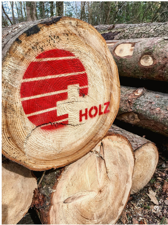
Abb 5 Die Forderung nach mehr Schweizer Holz dürfte die schweizerische Waldpolitik auch 2018 beschäftigen.

terie 2050 durch das Schweizer Volk am 21. Mai 2017 berichtet. Das erste Massnahmenpaket führte zu einer umfangreichen Revision auf Verordnungsstufe, wobei der grösste Teil dieser Verordnungen am 1. Januar 2018 in Kraft trat. 11 Die für den Wald relevanten Reformen ergeben sich vor allem aus dem neuen Energiegesetz (EnG, SR 730.0) und aus der Energieverordnung (EnV, SR 730.01), in der unter anderem Förderung und Ausbau der erneuerbaren Energien geregelt werden. Der Entscheid, dass Wind-, Wasser- und Pumpkraftwerke ab einer bestimmten Grösse künftig zu Vorhaben von nationalem Interesse erklärt werden können, ist für den Wald besonders relevant. Solche Anlagen können nach erfolgter Güterabwägung in Naturschutz- und Waldgebieten einfacher gebaut werden als bisher.