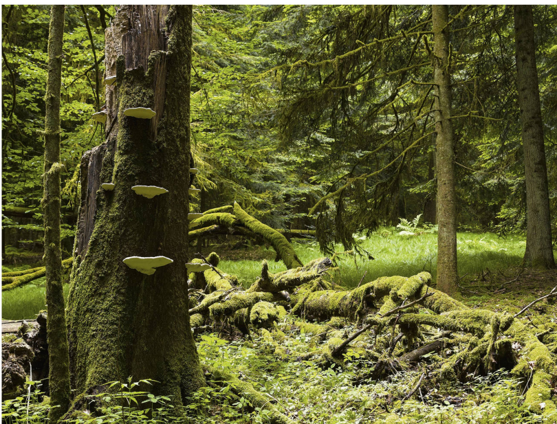
Abb 4 Der Aktionsplan zur Strategie Biodiversität Schweiz sieht unter anderem die weitere Förderung von Waldreservaten und die Sicherstellung von Tot- und Altholz vor.

Im September 2017 genehmigte der Bundesrat die Revision der Bundesinventare der Biotope von nationaler Bedeutung (Trockenwiesen und -weiden,