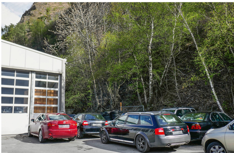
Abb 3 Das Bundesgericht behandelte 2017 vor allem klassische walddpolitische Fragen beispielsweise zum Thema Waldabstand.