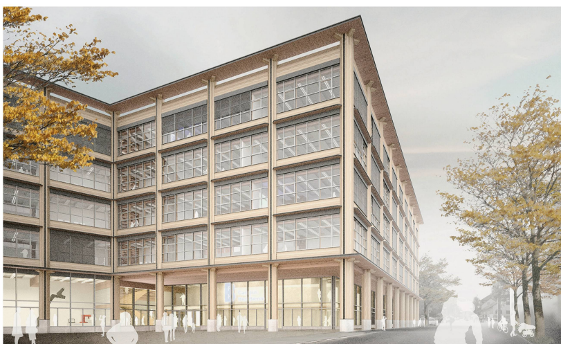
Abb 3 Der neue Campus Biel der Berner Fachhochschule soll aus Berner Holz gebaut werden. Ab Herbst 2022 werden darin die beiden Departemente Technik und Informatik sowie Architektur, Holz und Bau untergebracht sein.

Aufgaben an geeignete Organisationen der Waldeigentümer möglich (KWaG Art. 40). Mit einer entsprechend flexiblen Revierorganisation soll die unternehmerische Entwicklung der Waldwirtschaft unterstützt werden. Amtliche (kantonale) und betriebliche Aufgaben können somit organisatorisch zusammen erfüllt werden, sofern dies die Waldwirtschaft fördert (B).