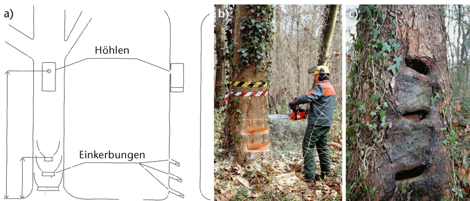
Abb 2 Künstlich erzeugte Habitatstrukturen an Hybridplatanen: a) grafische Darstellung von Höhlen und Einkerbungen; b) Anbringen und c) Entwicklung von Einkerbungen am Stammfuss mit der Zeit.