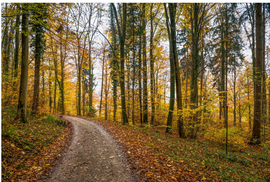
Abb 3 Der Waldstrassenunterhalt erfolgt im Forstbetrieb Rheinfelden-Magden-Wallbach abgestimmt auf die unterschiedlichen Bedürfnisse von Waldbewirtschaftung und Erholungsnutzung: Ein hoher Unterhaltsstandard wird nur noch auf den Hauptwegen wie im Bild angewendet.

durch Extensivierungen sowie die Ausnutzung der biologischen Automation. Für die Holzernte wird noch stärker auf Unternehmenseinsatz gesetzt (mehr Buy statt Make). Zudem wurden Waldbewirtschaftungseinheiten gebildet, um die Holzschläge räumlich zu konzentrieren und so die Umsetzkosten zu senken. Indem die operative Leitung des Forstbetriebs neu durch den Revierförster erfolgt und der Oberförster als Geschäftsführer der Ortsbürgergemeinde Rheinfelden amtiert, konnte auch der Verwaltungsaufwand reduziert werden.