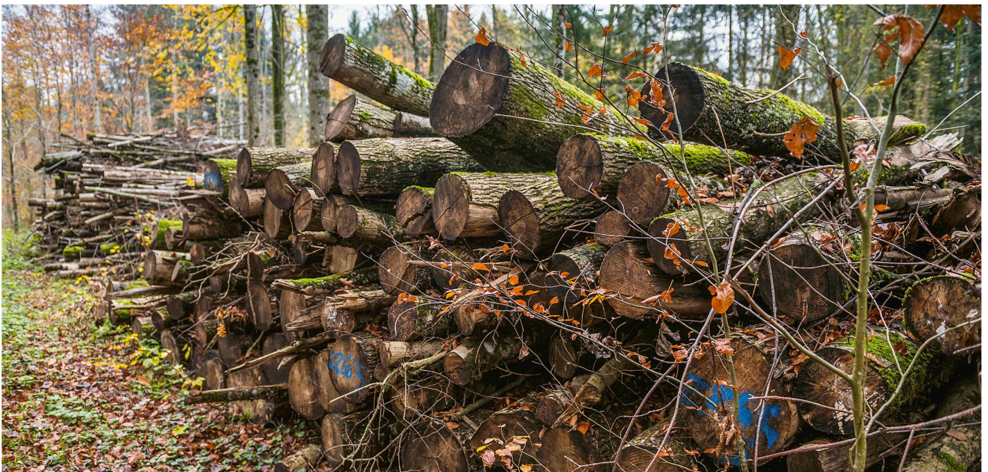
Abb 1 Schnitzelholz ist zum Hauptprodukt des Forstbetriebs avanciert. Diese Form von Energieholz ermöglicht und bedingt sehr rationelle Holzernteverfahren.

Im Jahr 1991 wurden dem Forstbetrieb Rheinfelden die Bewirtschaftung der Staatswaldungen Forst in Möhlin sowie Chisholz in Wallbach und Zeiningen (total 191 ha) und des Gemeindewalds Wallbach (73 ha), im Jahr 1997 zusätzlich die Bewirtschaftung des Gemeindewalds Magden (419 ha) übertragen. Ein Jahr später