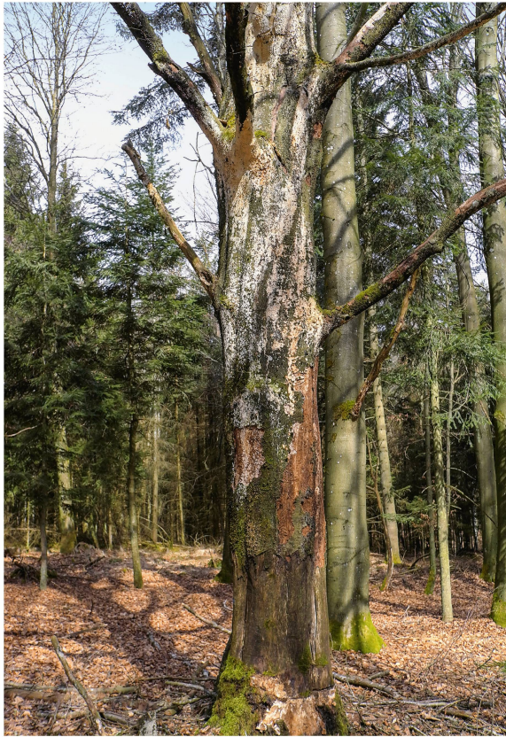
Abb 2 Aktives Totholzmanagement: Buche vier Jahre nach dem Ringeln.

der anzureichern: ökologisch effizient im Sinne einer möglichst schnellen und umfassenden Verbesserung der natürlichen Biodiversität, ökonomisch effizient im Sinne einer möglichst kostengünstigen Bereitstellung bzw. alternativer Erträge (z.B. Vertragsnaturschutz) und auch effizient im Sinne der Betriebssicherheit (Klimawandelfolgen, Arbeitssicherheit, Verkehrssicherung, Arbeitsergonomie etc.). Der Umgang mit Totholz ist im Waldbetrieb Eichelberg im dazu entwickelten Konzept «BioHolz» umfassend geregelt. Aktuelle Praxiserfahrungen und neu gewonnene wissenschaftliche Erkenntnisse werden laufend integriert.