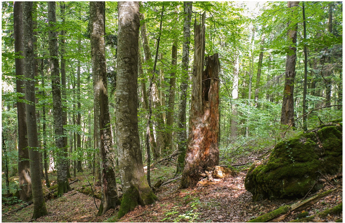
Abb 1 Buchen-Edellaubholz-Tannen-Urwald in den Karpaten.