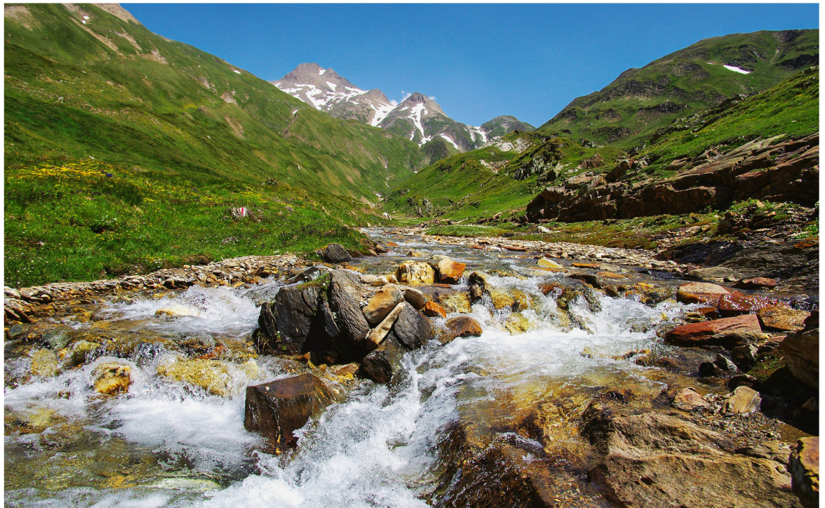
Abb 5 Mit der Revision des Bundesinventars der Landschaften und Naturdenkmäler von nationaler Bedeutung (BLN) wurde die Rechts- und Planungssicherheit verbessert. Das hintere Binntal ist eines der 162 BLN-Objekte.

scheid 602 2016 159 vom 9. Februar 2017 den Entscheid der Raumplanungs-, Umwelt- und Baudirektion (Genehmigung der Ortsplanungsänderungen für den Windpark) auf. Als Begründung führte es wie das Bundesgericht aus, dass im Richtplan keine genügende Grundlage für den Windpark besteht.