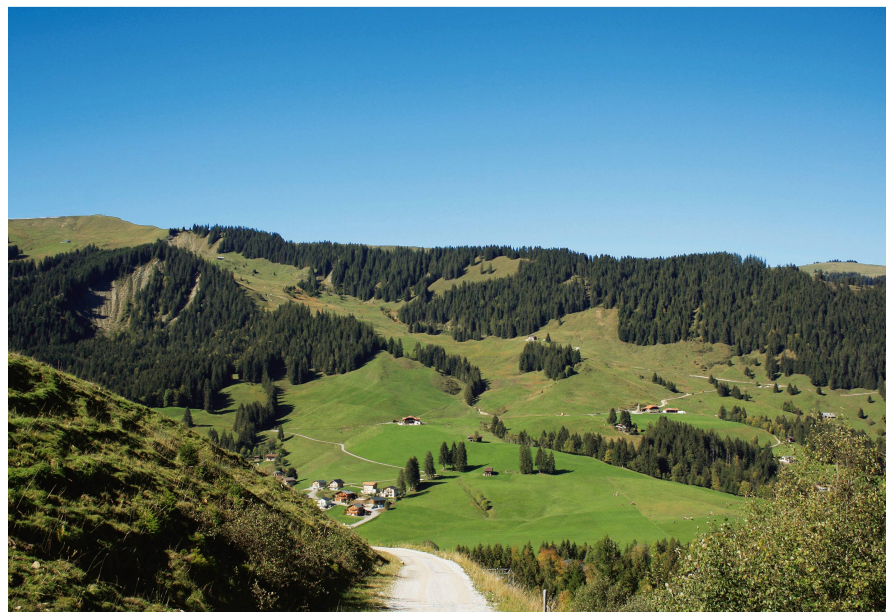
Abb 4 Das Bundesgericht entschied sich gegen einen Windenergiepark, welcher auf dem Schwyberg im Kanton Freiburg erbaut werden sollte.