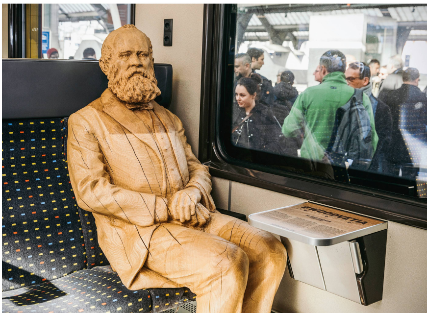
Abb 1 Eisenbahnpionier Alfred Escher, eine der Holzfiguren der Kampagne «#WOODVETIA», fährt bis Ende Jahr mit seinem Generalabonnement auf der Gotthardstrecke.

Nebst der Waldgesetzgebung hat sich die Bundesverwaltung intensiv mit dem Thema Holz befasst. Im September 2016 hat die BAFU-Direktion den überarbeiteten Aktionsplan Holz für die Jahre 2017 bis 2020 genehmigt (BAFU 2017). Drei Schwerpunktthemen wurden festgelegt: 1) Optimierte Kaskadennutzung, 2) klimagerechtes Bauen und Sanieren, 3) Kommunikation, Wissenstransfer und Zusammenarbeit. Damit einhergehend hat das BAFU Anfang 2017 die Kampagne «#WOODVETIA – Aktion für mehr Schweizer Holz» lanciert. Ziel der Kampagne ist, mit lebensgrossen Holzfiguren von Schweizer Persönlichkeiten (Abbildung 1), die in der ganzen Schweiz zu finden sind, der Bevölkerung das Material Holz näherzubringen. 1