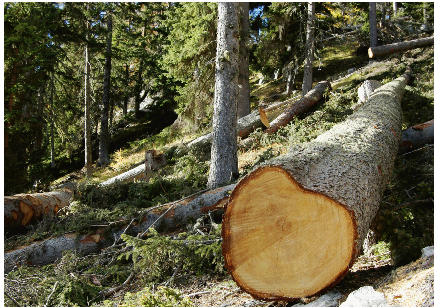
Abb 2 Das Parlament verlangt, dass subventionierte Aufgaben wie die Pflege von Schutzwäldern künftig nicht mehr der Mehrwertsteuer unterliegen.

stimmungen für die Verwendung von nachhaltig produziertem Holz bei Bauten des Bundes wurden im Rahmen der Ergänzung des WaG eingeführt. Nachdem der Nationalrat im September 2016 für die Motion 15.3081 «Rohholztransporte. Erhöhung des zulässigen Gesamtgewichts von 40 auf 44 Tonnen» stimmte, wurde dieses Anliegen im März 2017 vom Ständerat abgelehnt. Die beiden Geschäfte 15.3285 «Befristete Aufhebung der LSVA für Rohholztransporte inklusive Leer-Rückfahrten» (Postulat) und 15.3034 «Frankenschok für Schweizer Waldbesitzer und Holzindustrie» (Interpellation) wurden im Frühjahr 2017 unbehandelt abgeschlossen.