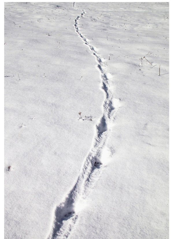
Abb 2 Es zeichnet sich ab, dass grosse Beutegreifer durch ihre Einwirkung auf Wildhuftierpopulationen sowohl die Raumverteilung wie die Dichte der Beutetiere beeinflussen und indirekt die natürliche Waldverjüngung fördern. Wolfsspur im Raum Calanda GR.

Im Mittelland hat die Freizeitnutzung der Wildtierlebensräume ein untragbares Ausmass angenommen. Sowohl das Gesundheitswesen als auch die Sportgeräte- und -bekleidungsindustrie und die ländliche Gastronomie können an den sportlichen Aktivitäten in den Mittellandwäldern nichts Negatives finden. Dennoch erzeugen sie Störung in einem bis vor Kurzem noch ungekannten Ausmass. Mit Folgen: Selbst Rehe, die als ziemlich störungsrobust gelten, ziehen sich aus der Nähe von Wegen zurück und verlieren weitere Teile ihres bereits heute eingegengten Lebensraums (Signer et al 2016). Zudem ist in den Agglomerationen die 24-Stunden-Nutzung der Wälder als Sportssubstrat mit der gesetzlichen Pflicht zum Schutz der Wildtiere vor Störung unvereinbar. Hier ist Handlungsbedarf – auch wenn der Eindruck besteht, dass sich bei den Flächenverantwortlichen angesichts der Massen an «Erholung suchenden» Menschen eine tiefe Resignation breit macht. Kommt hinzu, dass kaum jemand aus der schwitzenden und stöhnenden Schar an waldbnutzenden Sportlerinnen und Sportlern sich der eigenen Störwirkung auf den Wald und die darin lebenden Wildtiere bewusst ist – der Wald als Kulisse und Sauerstofftank!