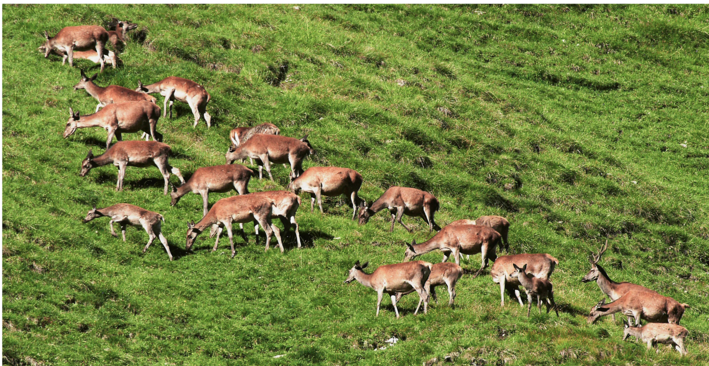
Abb 1 Ungestörtheit ist für den Rothirsch ein Grundbedürfnis. Er findet sie in abgelegenen und unzugänglichen Geländekammern, in Grossschutzgebieten (Schweizerischer Nationalpark; Bild), in Wildruhezonen und Wildschutzgebieten.

drängungsvorgänge, Aussterbeprozesse, schnelle Bestandsentwicklungen oder rasante Einbrüche vor sich gehen. Vor dieser Komplexität zu kapitulieren und den Schluss zu ziehen, dass Nichtstun das Beste wäre, da mit jedem Eingriff mehr Schaden als Nutzen entstehen könnte, ist als Gedankenexperiment zwar verlockend. In dafür bestimmten Grossschutzgebieten wie dem Schweizerischen Nationalpark wird dieses Gewährenlassen zu einem Gutteil umgesetzt (Abbildung 1) und bringt viel Erkenntnisgewinn. Es hilft aber in einem zivilisatorisch geprägten Mitteleuropa nicht weiter, wenn es darum geht, ein Neben- oder Miteinander der unterschiedlichen Ansprüche und Bedürfnisse von Pflanzen, Pilzen, Tieren und Menschen anzubahnen und zu halten.