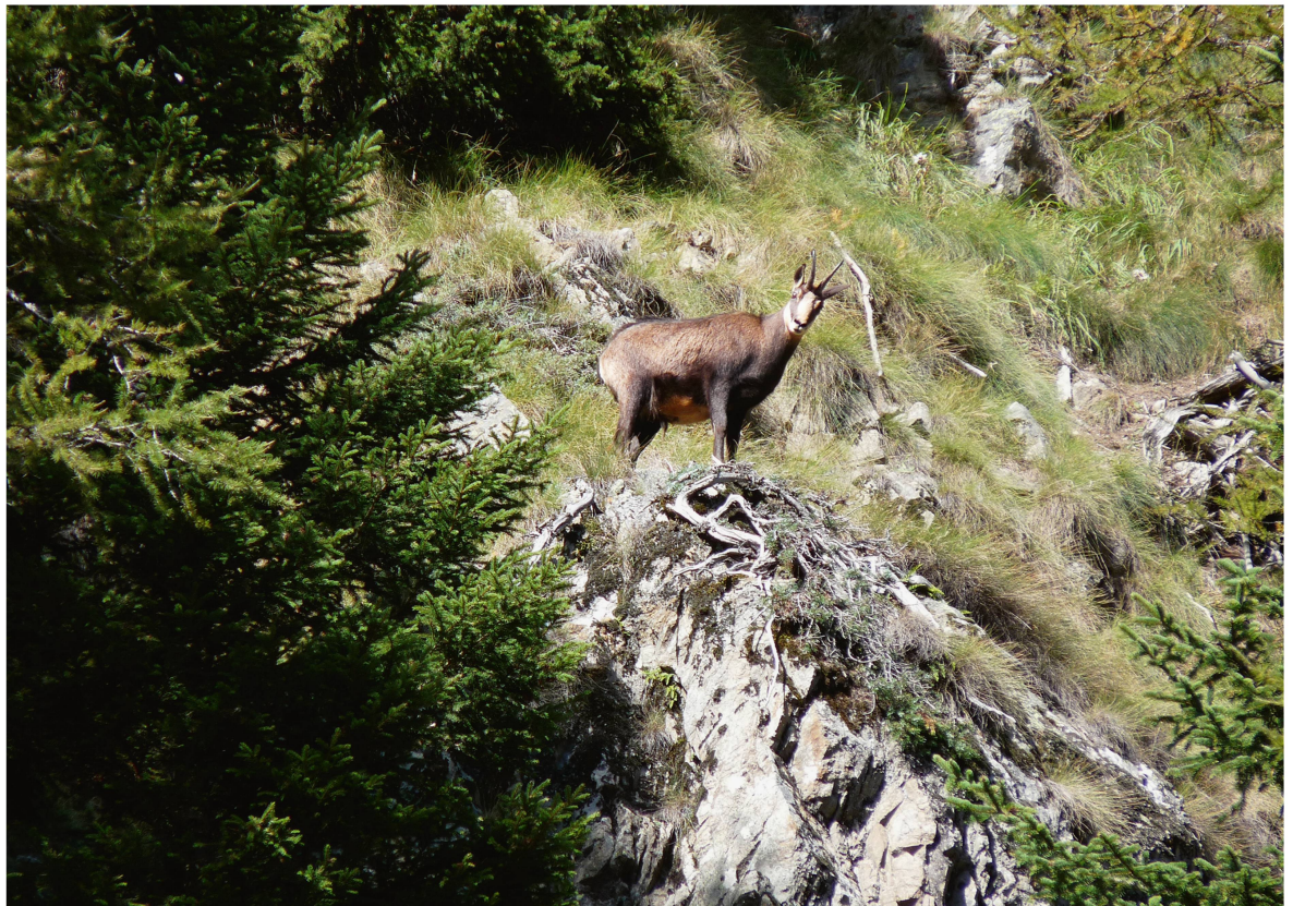
Fig. 2 Une régulation des gestions des ressources faunistiques et forestières est nécessaire pour en assurer leur durabilité.

de la régulation des rivalités d'usage, qui est commun à la plupart des ressources menacées d'une surcharge ou d'une sous-exploitation (figure 2). En l'occurrence, il s'agit de fixer des normes, valables pour l'ensemble des acteurs-usagers des deux ressources en question, normes qui, d'une part, leur attribuent des droits d'usage (sous une forme juridique ou non) et, d'autre part, délimitent ces droits d'usage en vertu d'une protection des autres droits d'usage concurrents exercés sur la même ressource. Ces régulations expriment des jugements de valeur politiques sur la légitimité de l'un ou de l'autre de ces usages, qui sont susceptibles de changer au cours du temps et selon les régions. Si ces régulations se veulent explicitement «durables», elles se proposent de résoudre ces rivalités dans l'intérêt de la survie (c'est-à-dire le maintien de la capacité de reproduction) des ressources, aussi bien prestataires que desservies (dans le cas de rivalités interressourcielles). Ces régulations passent le plus souvent par la définition de seuils concernant aussi bien le niveau de dégâts forestiers qui sont considérés comme acceptables que le cheptel à la fois minimal et maximal souhaitable, afin de ne mettre en danger ni la reproduction de la ressource faune, ni la gestion durable de la ressource forêt.