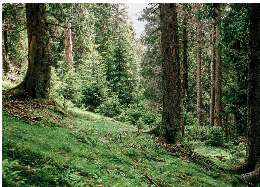
Abb 1 Neben guten waldbaulichen Entscheidungen auf der Einzelfläche ist für eine nachhaltige Funktionserfüllung der Schutzwälder auch die Frage zentral, wie viel Fläche jährlich zu behandeln ist.

Die verbleibenden Flächen wurden anhand der Vegetationshöhenstufen (als vereinfachten Abbilds der Standorteigen-