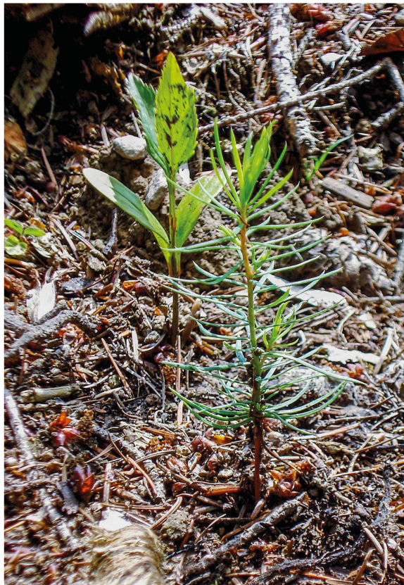
Abb 1 Natürlich verjüngte Douglasie neben einem Eschenkeimling.