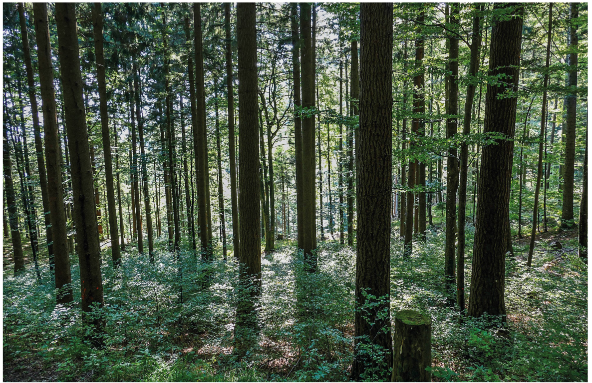
Abb 3 Für die Schweiz typisches, kleines Vorkommen von Douglasien.

bestehen und räumlich klar abgrenzt sind (Abbildung 3), eine hohe Aussagekraft besitzen, wird von uns bezweifelt. Wir schätzen die Kosten für die Untersuchung der Auswirkungen der Douglasie auf die Diversität der übrigen genannten Artengruppen (Vegetation, Moose, Pilze, Flechten, Insekten, Mollusken) entlang von Mischungsgradienten auf rund 400 000 Schweizer Franken.