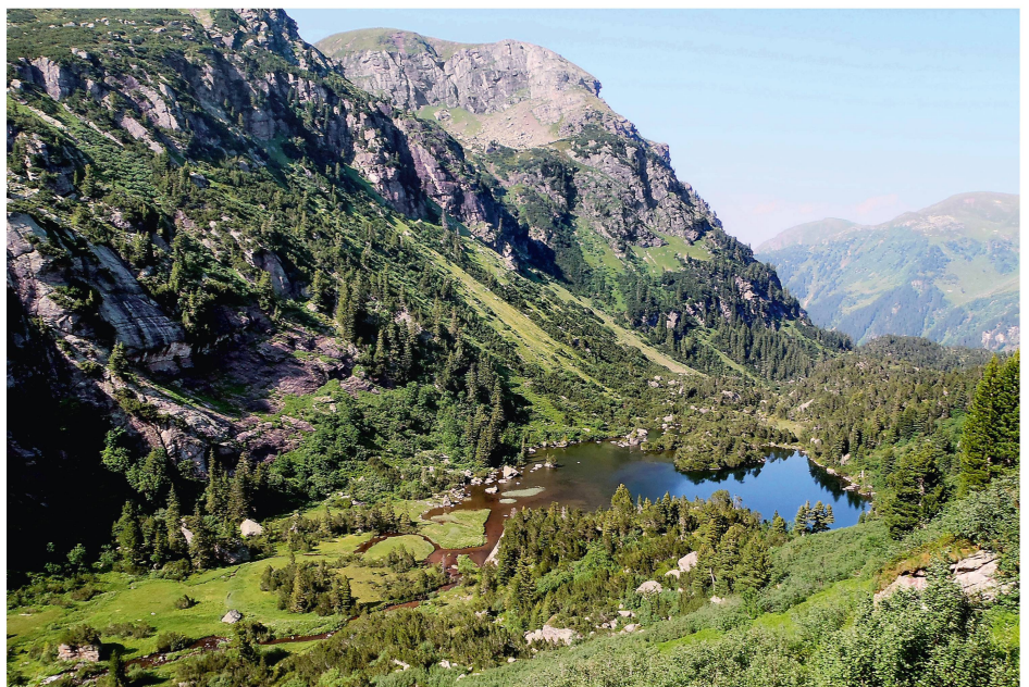
Abb 1 Oberes Murgtal (SG; im Bild) und angrenzendes Mürttschental (GL) umfassen zusammen die grösste Reliktpopulation der Arve ( Pinus cembra ) auf der Alpennordseite mit über 20 000 Individuen.

Rechtsgrundlage auf nationaler Ebene bildet die Waldgesetzgebung betreffend forstliches Vermehrungsgut, Förderung der biologischen Vielfalt des Waldes und Förderung von Forschung und Entwicklung. Die Strategie Biodiversität Schweiz bekräftigt mit dem strategischen Ziel 7.4 die generelle Bedeutung der Erhaltung von genetischer Diversität und von Genressourcen (BAFU 2012). Die Vollzugshilfe zur Erhaltung und Förderung der biologischen Vielfalt im Schweizer Wald erläutert die Ausscheidung von Generhaltungsgebieten (Imesch et al 2015). Ein nationales Konzept «Forstliche Genressourcen und