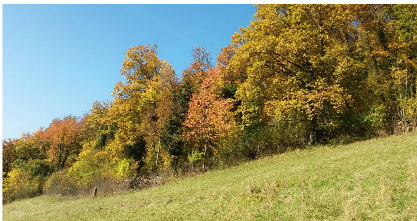
Abb 1 Südexponierte Waldränder wie hier am Schenkenberg in Thalheim (Kanton Aargau) gelten als ökologisch besonders wertvoll.

folgsfaktoren bei Waldrandaufwertungen. Bei den von Spörri et al (2014) in einer Pilotstudie im Kanton Aargau untersuchten 20 aufgewerteten Waldrändern wurde allerdings kein signifikanter Zusammenhang zwischen Aufwertungserfolg und Exposition und/oder Wüchsigkeit des Standorts festgestellt.