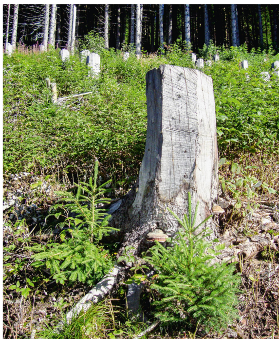
Abb 2 Schutzwaldpflege: Verjüngung einer dichten Aufforstung im Leimbach, Gemeinde Frutigen.

Eine Vereinfachung des Vollzugs bei gleichzeitiger Verbesserung der Wirkung könnte mit dem Wechsel von heute leistungsorientierten hin zu wir-