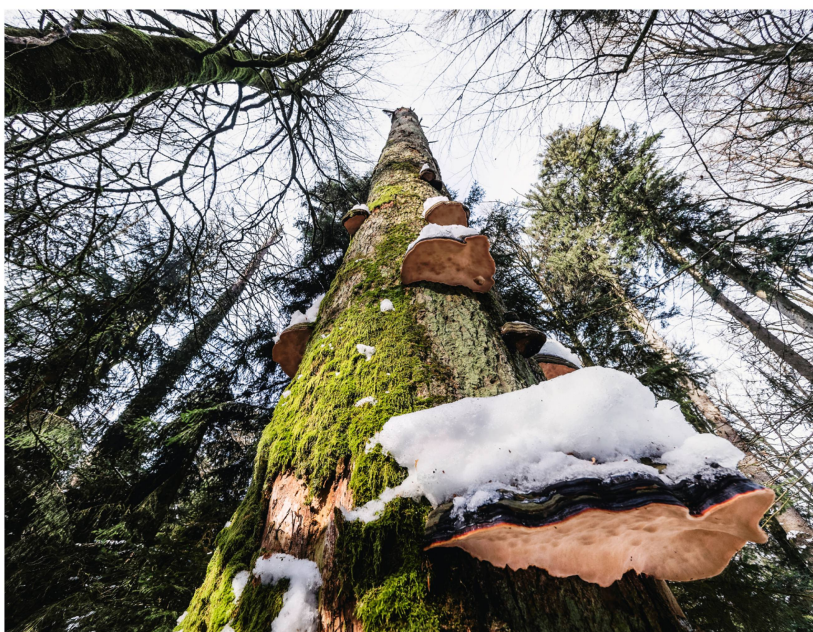
Abb 3 Totholz im Waldreservat Mettlenrain-Höchi, Gemeinde Wynau.

kungsorientierten Beiträgen erzielt werden. Hostettler (2005) schlägt ein Modell zur Wirkungsfinanzierung der Schutzwaldpflege vor, bei dem die Beiträge für den Erfüllungsgrad der Schutzwirkung statt für die wiederkehrenden Leistungen ausgerichtet werden. Dadurch würde für leistungsfähige Forstbetriebe der Anreiz erhöht, den nötigen Zustand des Schutzwaldes bezüglich Art und Turnus der Eingriffe mit einer optimalen Bewirtschaftung und minimalem Mittelaufwand zu erhalten. Die wesentlichen methodischen Fragen zum Modell, beispielsweise die Festlegung der Fläche oder die Beurteilung der Wirkungsfähigkeit von Schutzwald, wären heute weitgehend lösbar.