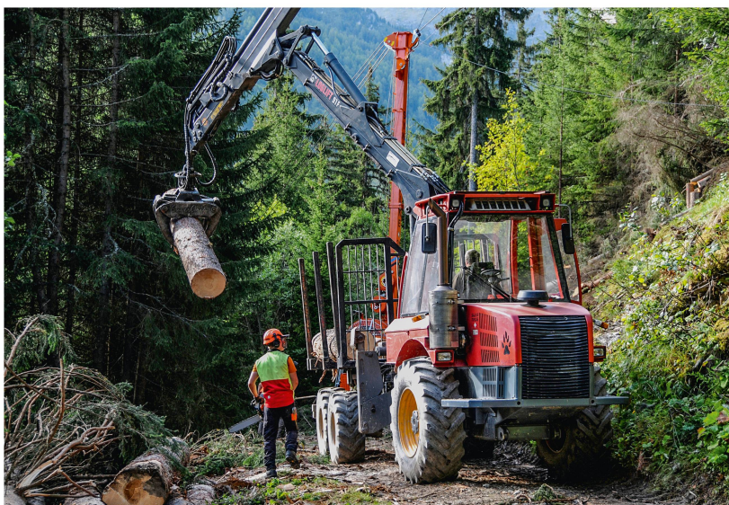
Fig. 2 La mécanisation des travaux forestiers lourds: un équipement pour les triages ou les entreprises forestières privées?

aussi bien leur employeur, les communes, et les tiers qui leur assurent la diversification des travaux; les diverses casquettes ne sont pas facilement interchangeables! Le canton, avec la mise en œuvre de la Réforme de la péréquation et de la répartition des tâches (RPT), a clarifié et consolidé la fonction de haute surveillance des gardes via un mandat de prestations qui précise également les obligations des communes et les appelle à contribution. Par cette démarche, le canton affirme qu'il a d'abord besoin, en termes de structure et de réalisation des tâches légales, de triages forestiers qui sont à ce niveau irremplaçables et que les fonctions d'entreprise viennent en second plan et peuvent être assurées de diverses manières.