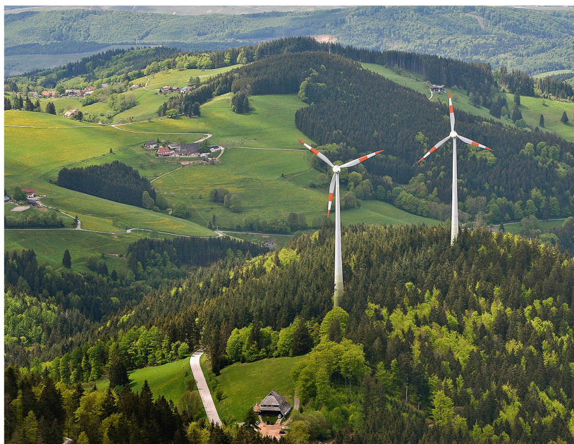
Abb 4 Windenergieanlagen im Wald werden auch künftig für Diskussionen sorgen.