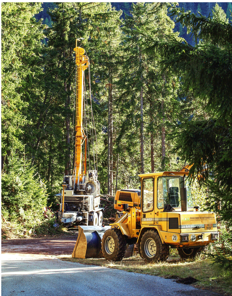
Abb 1 Die eidgenössischen Räte diskutierten die Aufgabentrennung zwischen Bund und Kantonen betreffend Finanzierung von Erschliessungsanlagen im Nichtschutzwald.