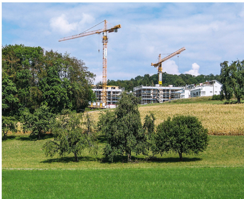
Abb 3 Das Bundesgericht behandelte 2015 zwei Fälle zum Thema Waldabstand.